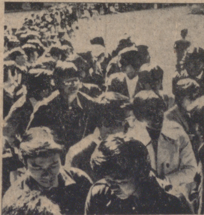
TOKIO.—Miles de personas esperan formando cola ante el Museo Nacional, donde ha sido inaugurada la exposición de La Gioconda ("Mona Lisa"), obra maestra de Leonardo da Vinci. Sólo se permite a cada visitante observar el cuadro por espacio de ocho segundos.