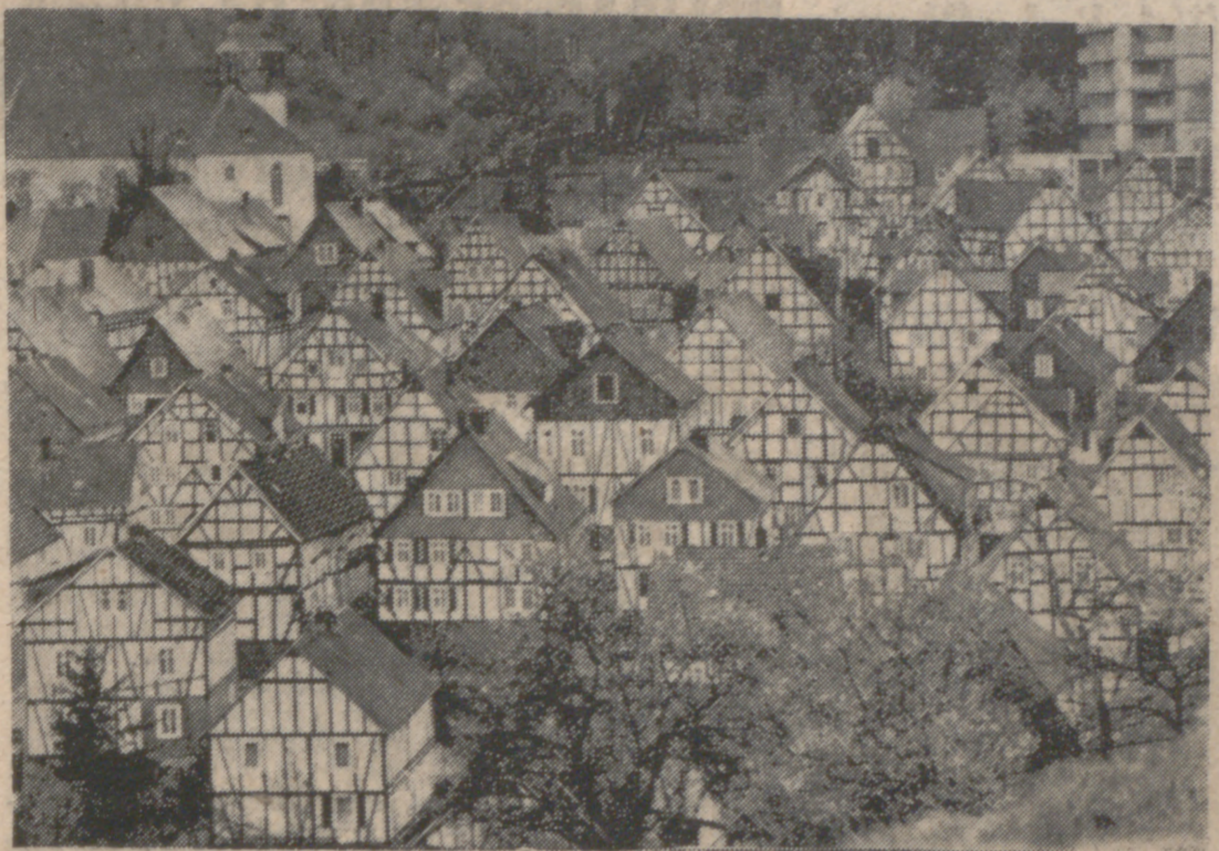
FREUDENBERG (Alemania).—Se distingue una apariencia unificada en las casas, mitad de madera, de la pequeña localidad de Freudenberg en la región central de Alemania. Todas las casas han sido pintadas, como suele hacerse, anualmente, en primavera, para que mantengan su estilo original, romántico, que data de hace varios siglos.