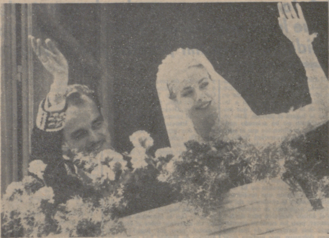
La boda de Rainiero de Mónaco y Grace Kelly fue espectacularmente cinematográfica. Ella, actriz de cine, tenía porte de princesa. Rainiero parecía un galán cinematográfico.

— EN EL SIGLO XX, MUCHOS PRINCIPES SE CASAN "POR AMOR"