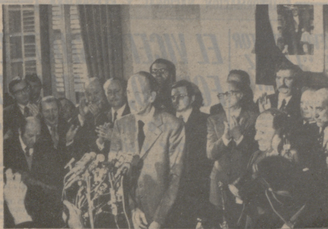
CHAMALIÈRES (Francia central). — El ministro francés de Asuntos Exteriores, Valéry Giscard d'Estaing, ha anunciado su presentación como candidato a la Presidencia de Francia durante un discurso pronunciado en esta pequeña localidad, de la que es también alcalde.