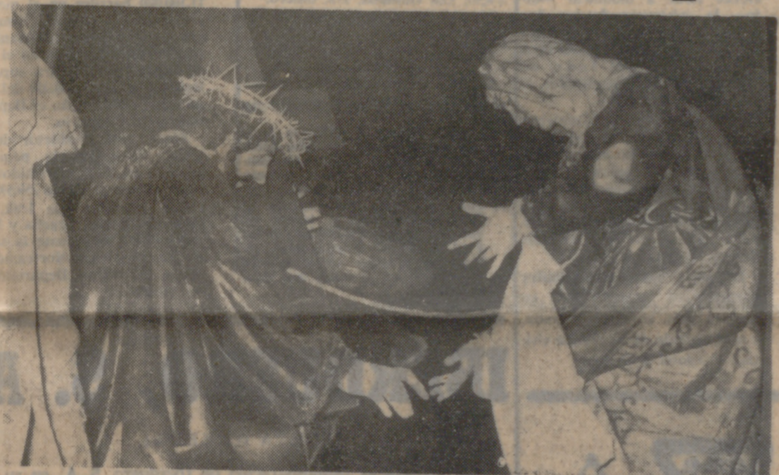
Se celebró en la noche de ayer la procesión del Santísimo Rosario del Dolor, en la que tomaron parte varios de los «pasos» y numerosos penitentes de distintos cofradías vallisoletanas. En página quinta ofrecemos información sobre este desfile procesional.