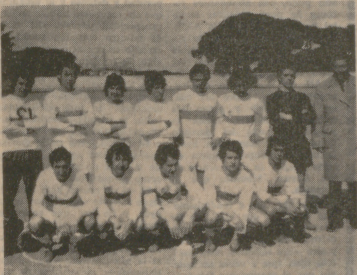
Formación del Beloit, que se impuso en un disputado encuentro al Atlético Valladolid.