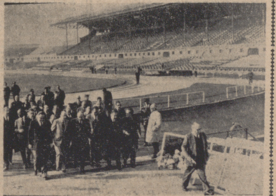
BARCELONA.—El ministro secretario general del Movimiento, señor Utrera Molina, acompañado del Delegado Nacional de Deportes, de las autoridades barcelonesas y de otras personalidades, durante su visita al antiguo Estadio de Monjuich, donde se proyecta la realización de una zona polideportiva.

OLOT (Gerona), 11. (Cifra).—Procedente de la capital de la provincia llegó a la cercana localidad de Vall de Vianya el Ministro Secretario General del Movimiento, don José Utrera Molina, acompañado de los delegados nacionales de Provincias y de Educación Física y Deportes, del Director de su Gabinete, del Jefe Provincial del Movimiento y Gobernador Civil de la provincia, así como de una nutrida comitiva de autoridades provinciales. A su llegada a la pequeña localidad han sido recibidos por las primeras autoridades locales.