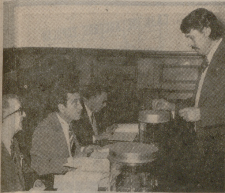
UN MOMENTO DE LA VOTACION

La elección de los diputados provinciales para cubrir las once vacantes existentes comenzó ayer, a las diez, en el salón de actos de la Diputación Provincial.