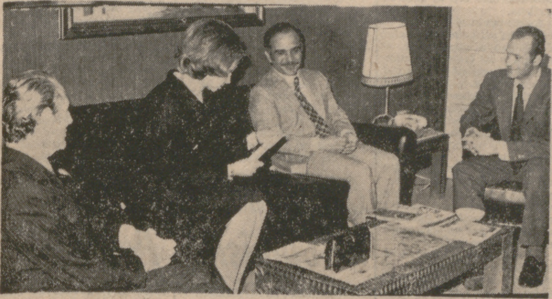
MADRID.—En la foto, el rey Hussein conversa con los Príncipes de España y el ministro de Asuntos Exteriores español, en una de las salas de la base aérea de Torrejón, momentos después de su llegada. — (Foto Cifra Gráfica.) — (INFORMACION EN SEGUNDA PAGINA)

En la base de Torrejón fue ayer recibido por los Príncipes de España