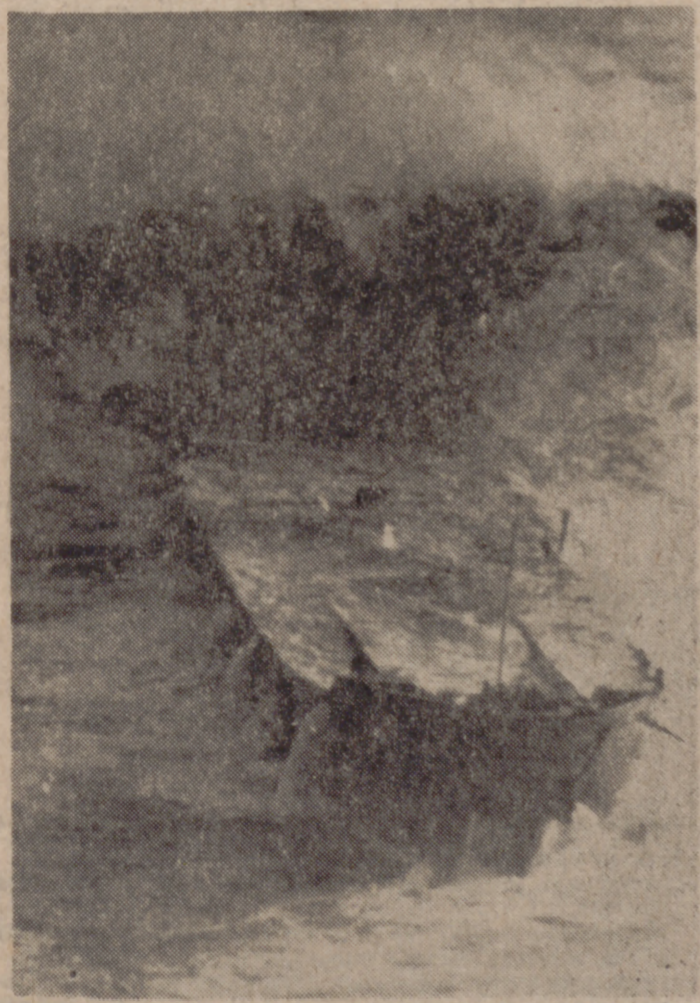
BILBAO.—Esta gabarra, que procedente de Avilés traía 3.800 toneladas de hierro, embarrancó en las peñas de Punta Galea, a la entrada del puerto de Santurce, hundándose poco después.