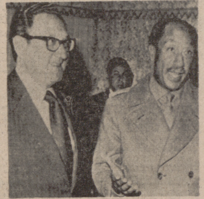
Sadat y Kissinger, en la residencia del primero en Assuan.

Señalan los funcionarios que Habib Burguiba, Presidente de Túnez, de setenta años, será elegido primer Presidente de la nueva República. (Pasa a la pág. siguiente)