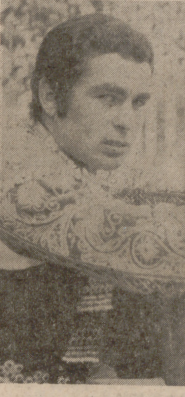
«Paquirri»: dos orejas en uno y vuelta en el otro.

mento de la duración que deben tener las faenas?