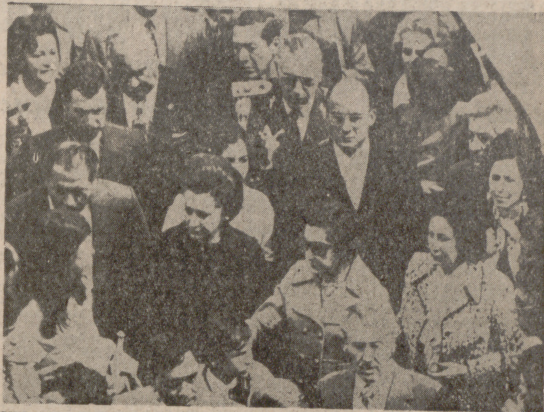
CIUDAD DE MEXICO.—La viuda del fallecido Presidente chileno, Salvador Allende, con gafas oscuras, a su llegada al aeropuerto de México, en cuyo país ha recibido asilo político. Junto a ella, con traje oscuro, la esposa del Presidente mexicano, y detrás de ambas, con gafas, el Presidente de este país, Luis Echevarría. Ambos, acompañados de otras altas personalidades mexicanas recibieron a la que fue primera dama chilena.