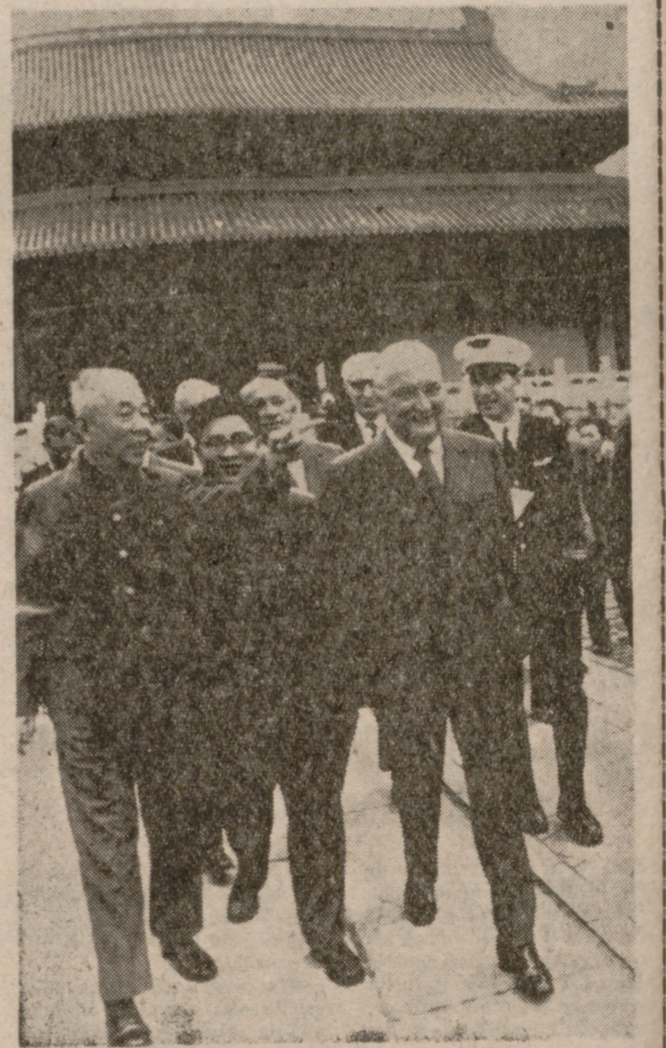
Pompidou visitó, en su viaje a China, la "ciudad prohibida".

Siguiendo la línea que trazó el general De Gaulle, y que fundamentalmente consiste en creer que aún se es uno de "los cinco grandes", que ya era una posición concedida por el interés norteamericano, he aquí que Francia, ahora con el Presidente Pompidou, intenta jugar a la gran política universal por su propia cuenta, haciendo como si desconociera el respaldo USA que en la realidad es el que le permite presumir de poder que autodetermina sus destinos. Habilitísima maniobra del genio francés, y de su diplomacia, que, jugando con las pugnas entre las auténticamente grandes potencias, permite a París, y se lo permitirá durante algún tiempo, por lo menos mientras Alemania no tenga las manos libres, operar libremente, apoyándose alternativamente en USA, en la URSS o en la China, hasta que, cuando llegue la hora de la verdad, que puede llegar muy pronto, tenga que reconocer sus limitaciones y buscar y aceptar las alianzas que, de momento, casi desprecia.