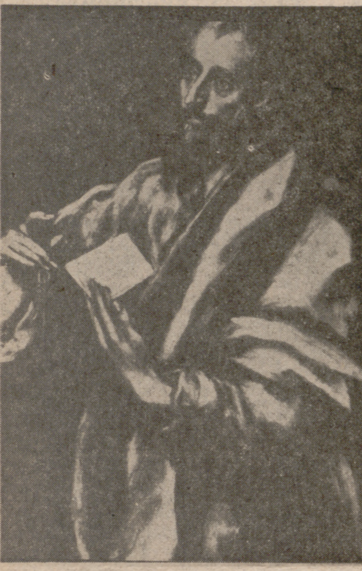
San Pablo, por El Greco.

El martirio del Príncipe de los Apóstoles y el del Apóstol de las Gentes tuvieron lugar en la ciudad de Roma el mismo día. Por semejante razón, desde remotos siglos, la gran fiesta anual consagrada por la Iglesia a ambos se mantuvo unida en la fecha conmemorativa del 29 de junio, enriquecida con invocaciones litúrgicas comunes, evocadoras del amor, de la inquebrantable fidelidad con que sirvió San Pedro al Divino Maestro, lo que fue causa de que le designara cabeza del Colegio Apostólico y fundamento de la Iglesia; y de la atrayente personalidad del heraldo de Cristo, que, tras haber alcanzado la plenitud de la gracia en el camino de Damasco, llegó hasta la inmolación de su existencia por difundir las verdades contenidas en los Evangelios.