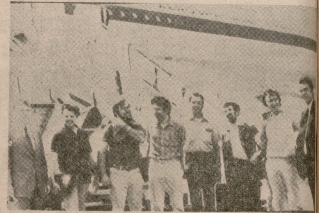
LAS PALMAS.—El prototipo «001», francés, del avión supersónico «Concorde», llegó ayer al aeropuerto de Las Palmas. A bordo viaja un grupo de astrónomos franceses, ingleses y americanos, que seguirán desde el avión el eclipse de mañana, sábado. En la foto, los siete científicos que observarán el eclipse desde el «Concorde».

Será sólo parcial en España y durará siete minutos y ocho segundos