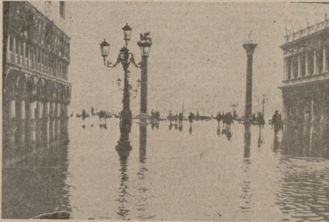
Las inundaciones de Venecia convirtieron con frecuencia la Plaza de San Marcos en los últimos años en un nuevo canal ciudadano.

Desde el primer momento se pretendió que las operaciones