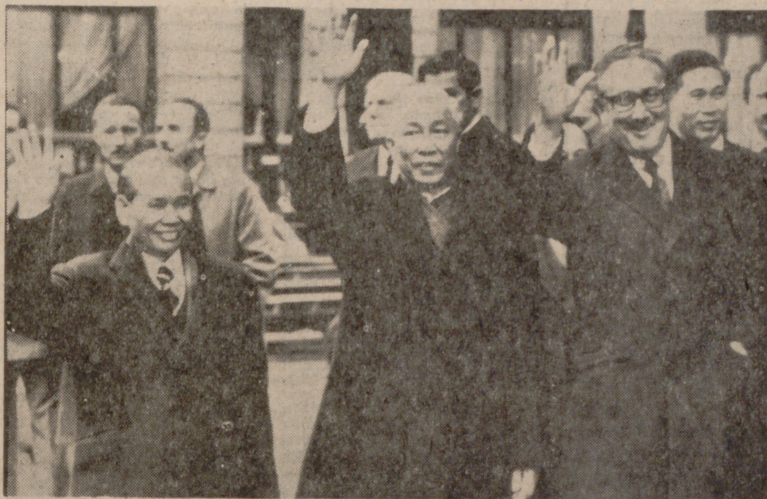
PARIS.—De izquierda a derecha, Xuan Thuy, Le Duc Tho, ambos de la delegación de Hanoi en las conversaciones de paz de París, y el consejero del Presidente Nixon, Henry Kissinger, fotografiados a la salida del centro de reuniones de la Avenida Kleber saludando a los periodistas, después de la reunión celebrada en la mañana de ayer, que fue decisiva para la paz.