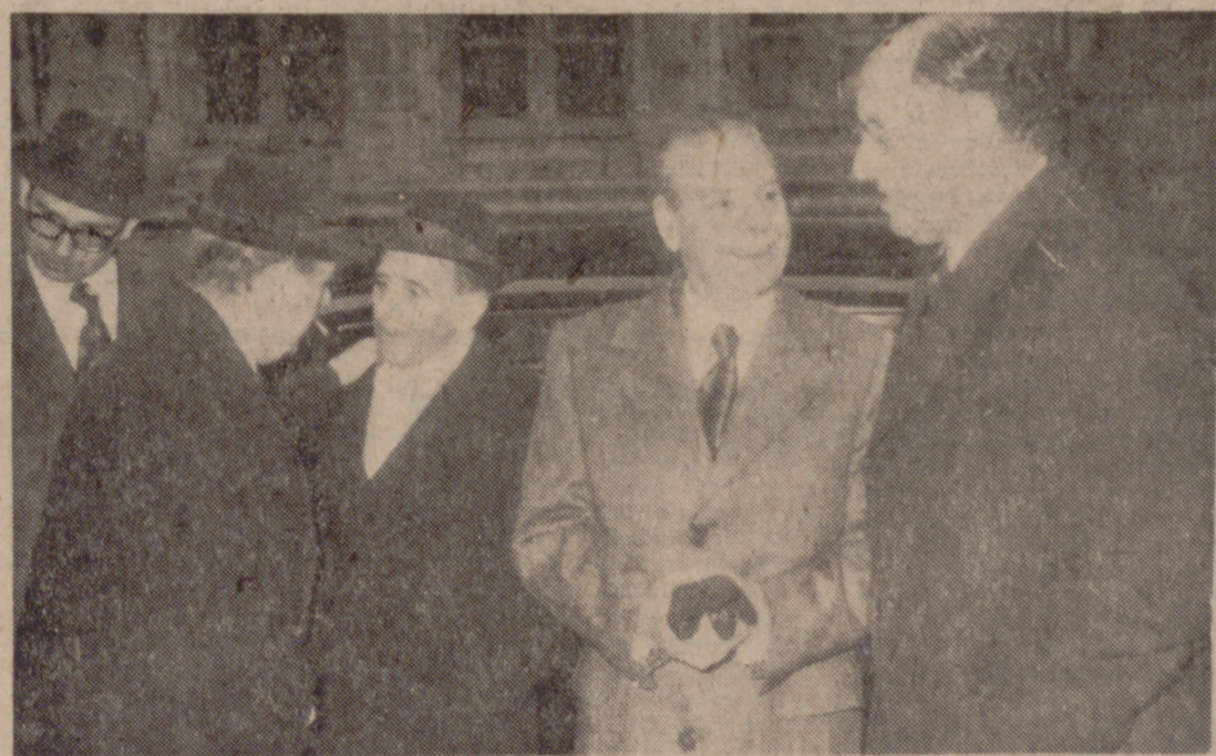
(INFORMACION EN LA PAGINA QUINTA)