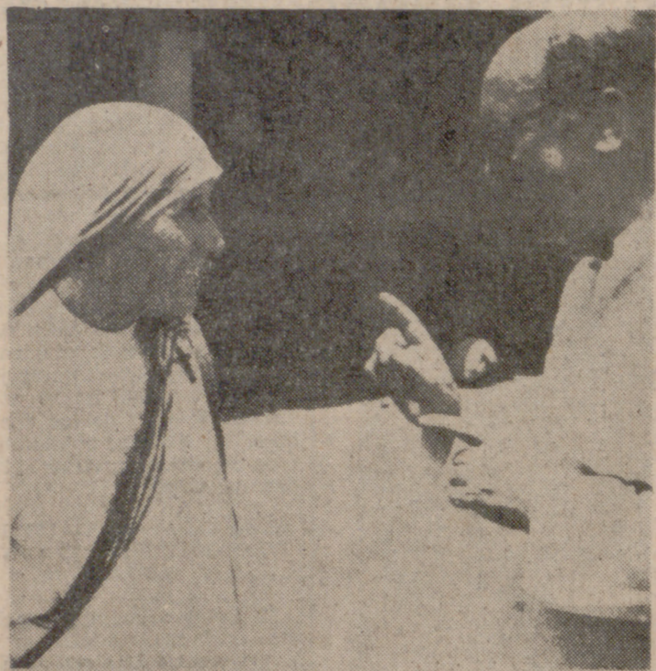
La madre Teresa Bojaxhiu.

como posible futuro Premio Nobel de la Paz— acaba de recibir en estos días el Premio Nehru de Colaboración Internacional por su dedicación constante a los pobres, a los enfermos y a los refugiados del mundo.