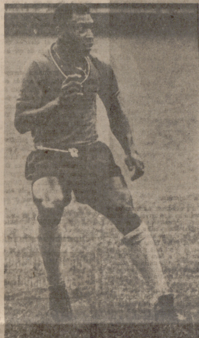
Pelé, el gran ausente del equipo nacional brasileño, a quien ya le han encontrado sustituto

LA MINICOPA FUE ASI Del 11 al 25 de junio se jugaba la