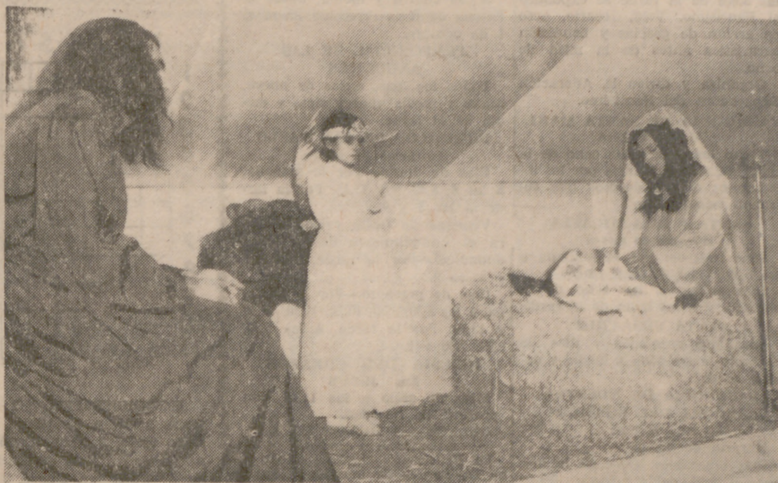
"Entre un buey y una mula. Dios ha nacido..."

Dios nos hace cada año, cada mes, cada día, cada hora. Quizá la mula y el buey del villancico hayan quedado un poco al margen de lo que es hoy la Navidad, porque huelen las calles a gasolina quemada, a humo de las chimeneas, a guisos y al frío de este invierno. Pero Dios sigue naciendo en cada uno de nosotros, como ha nacido en estos días, allí, en ese inmenso barrio que es la Rondilla de Santa Teresa, cerca del río, donde ya no bien los peces porque sus aguas están muy sucias, demasiado también para seguir la letra del otro villancico.