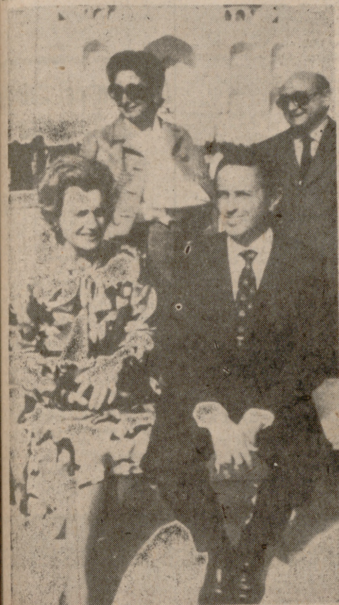
NEUA DELHI.—El ministro español de Asuntos Exteriores, don Gregorio López Bravo, acompañado de su esposa, durante la visita al Taj Mahal, en Agra. Detrás, el director general de Política Exterior.