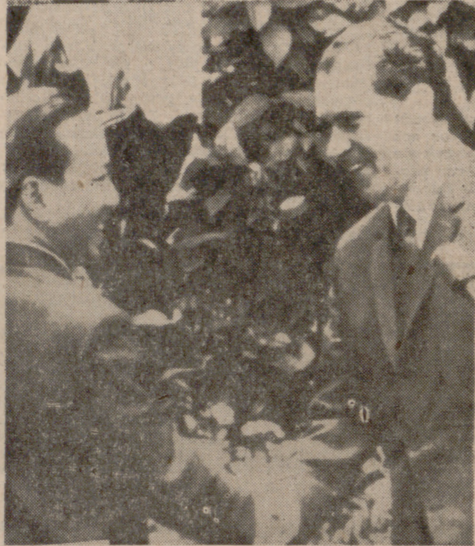
Van Thieu, en los tiempos en que todavía no habían surgido diferencias con Washington, estrecha la mano de Nixon.