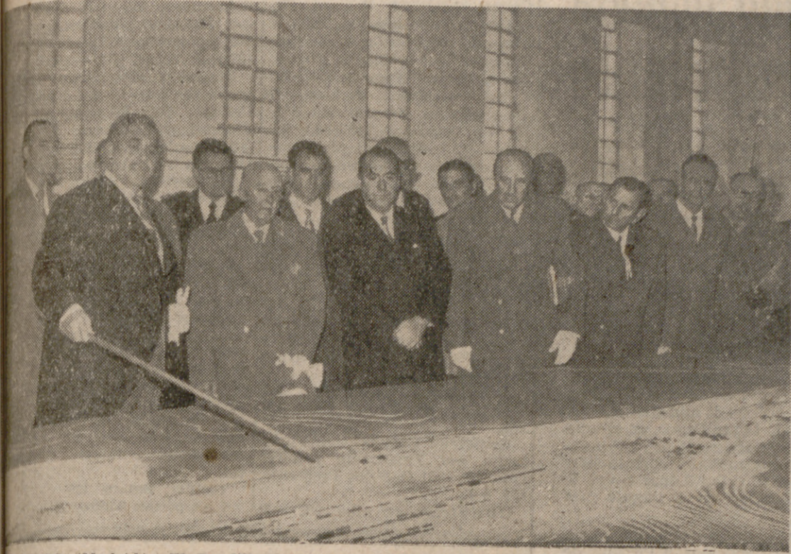
VICALVARO (Madrid).—El Caudillo, ante una maqueta de las instalaciones ferroviarias de Vicálvaro.

MADRID, 29. (Cifra).—Su Excelencia el Jefe del Estado inauguró ayer la estación de clasificación de Vicálvaro. El Jefe del Estado llegó acompañado del Ministro de Obras Públicas a la estación de Chamartín. Allí fueron recibidos por los ministros de Industria y del Ejército. El Jefe del Estado, acompañado por los cargos directivos de la Renfe, recorrió detenidamente las instalaciones de la estación, que tiene capacidad para 3.200 vagones diarios y es una de las más importantes de Europa. Ha requerido esta instalación una inversión de 700 millones de pesetas y significará un ahorro de 157 millones de pesetas al año, lo que supone un excepcional rentabilidad del 22 por 100.