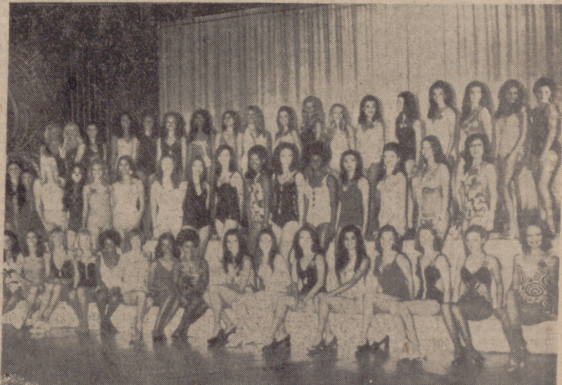
LONDRES.—Estas son todas las jóvenes procedentes de las cinco partes del planeta que aspiran al título de "Miss Mundo", cuya elección se efectuará el día 1 de diciembre.