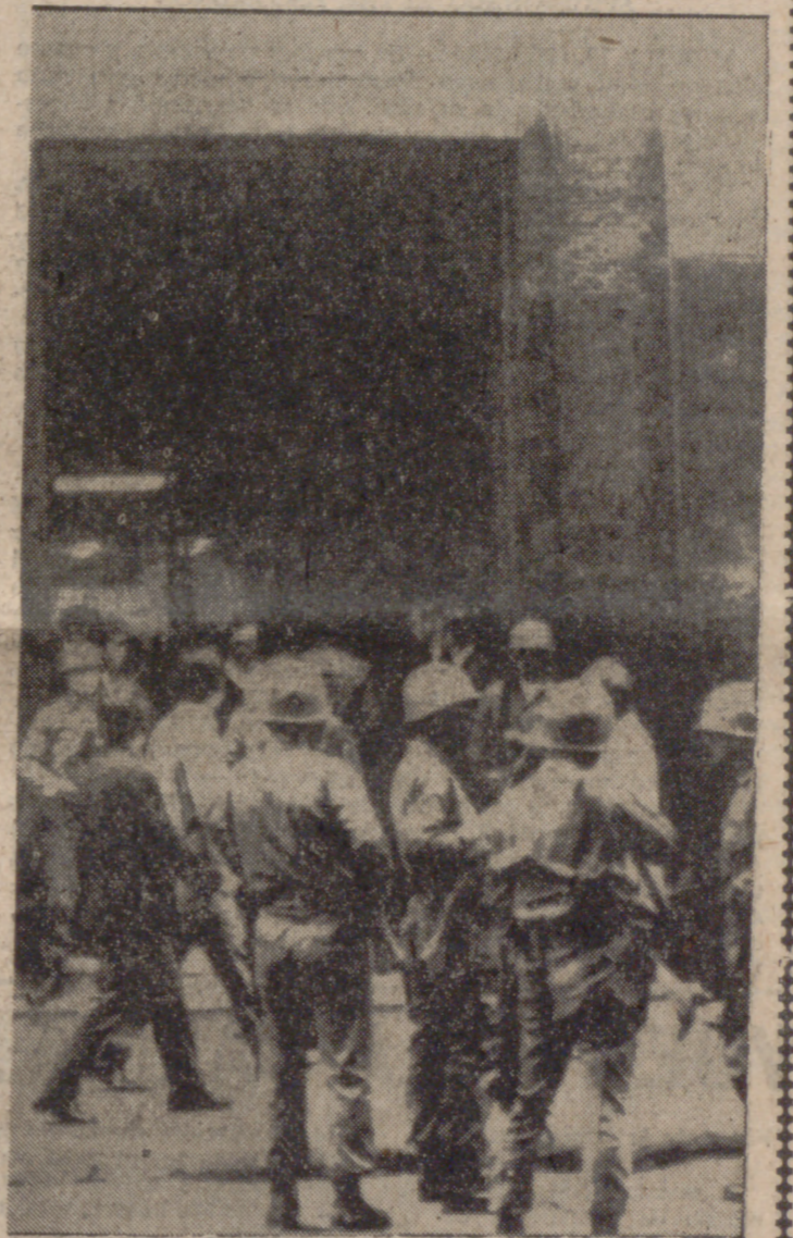
SANTIAGO (Chile).—Soldados dotados de fusiles automáticos montan guardia en torno al Banco de Santiago. Muchos empleados del Banco se unieron a una serie de movimientos huelguísticos que han paralizado las actividades comerciales en todo el país.

SANTIAGO DE CHILE, 19. (Efe).—Después de tres días de incidentes, la capital vivió ayer un día de normalidad, si bien con la presencia de policías uniformados en las calles y el patrullaje de "jeeps" y camiones ligeros del Ejército.