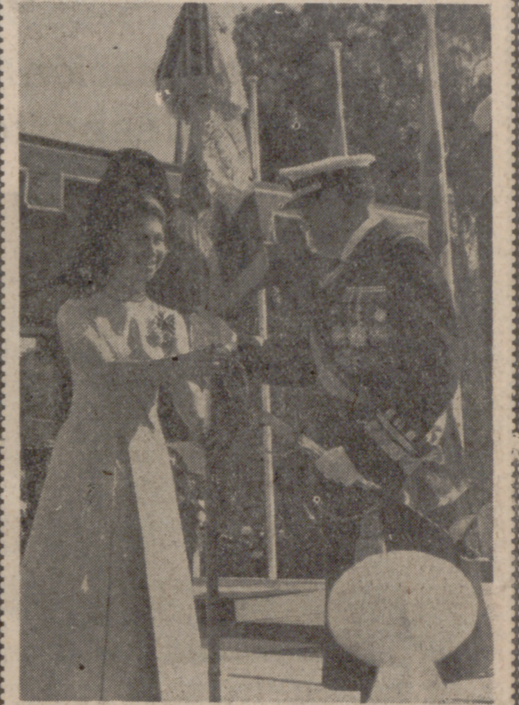
SAN FERNANDO (Cádiz).—La Princesa doña Sofía entrega al general jefe del Tercio de la Armada el estandarte de combate ofrecido a dicha unidad por el pueblo de San Fernando.

El cariño que toda España siente por nuestra gloriosa Infantería de Marina, puede representarse con justicia en la bella y marinera ciudad gaditana de San Fernando. Sus calles, sus héroes, la Isla, la música en la Alameda a cargo de su Banda, los niños desfilando siempre con el corazón en los ojos en pos de sus brillantes formaciones... No sorprende, pues, que todo un pueblo haya querido ofrecer un nuevo estandarte al "Tercio de Armada" que tiene su base en los antiguos acuartelamientos de la Isla de León. Altas jerarquías nacionales y el generoso madrazo de la princesa doña Sofía, dieron realce máximo al acontecimiento.