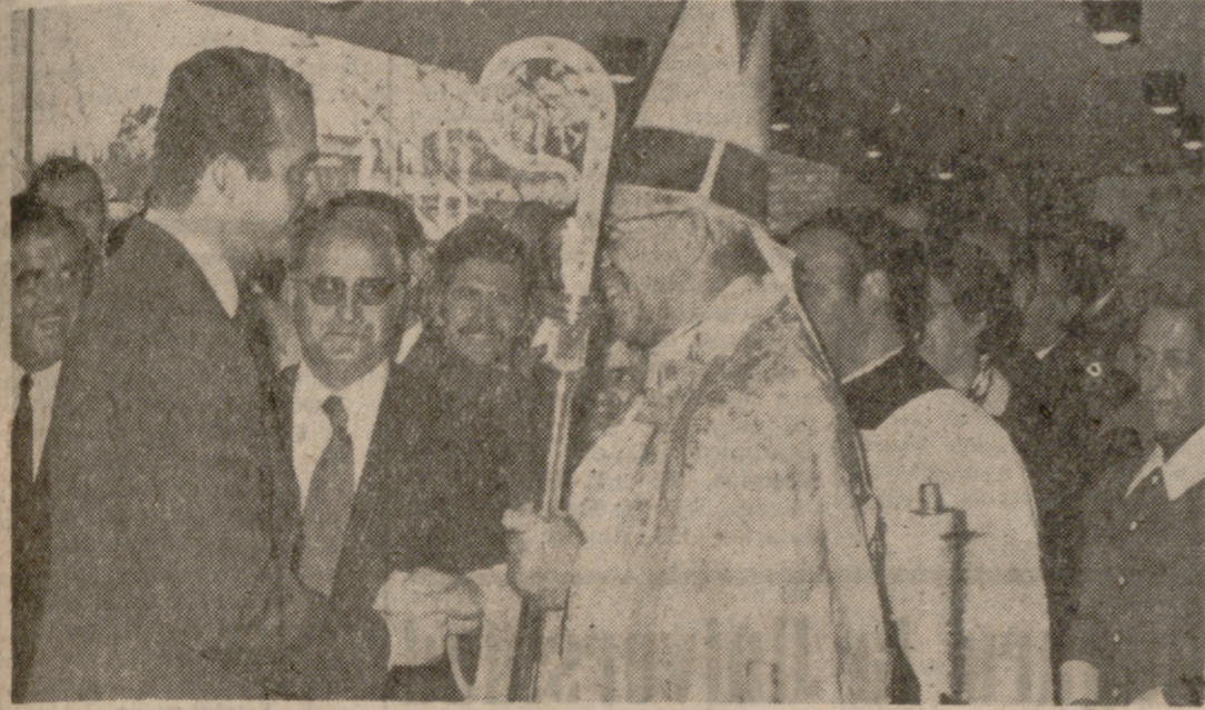
TOLEDO.—En la fotografía, don Juan Carlos de Borbón conversa con el Arzobispo Primado a su llegada a la nueva Universidad Laboral.

En el próximo curso se habrán duplicado los puestos escolares en estos centros