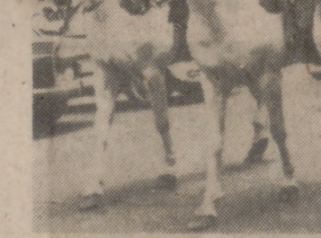
Jinetes españoles por las calles de Viena. Las mujeres, a la grupa, y la "carretela" enjaezada a la jerezana que cierra el desfile, despertaron oleadas de entusiasmo en la capital austriaca.

plata, recuerdo simbólico de Jerez, a cuyo gesto respondió tan alta autoridad entregando un ramo de flores a mi esposa. Por su parte, el Alcalde de Viena agradeció idéntico recuerdo en la visita que le hicimos, ofreciéndome una bandeja de plata con el escudo de su ciudad.