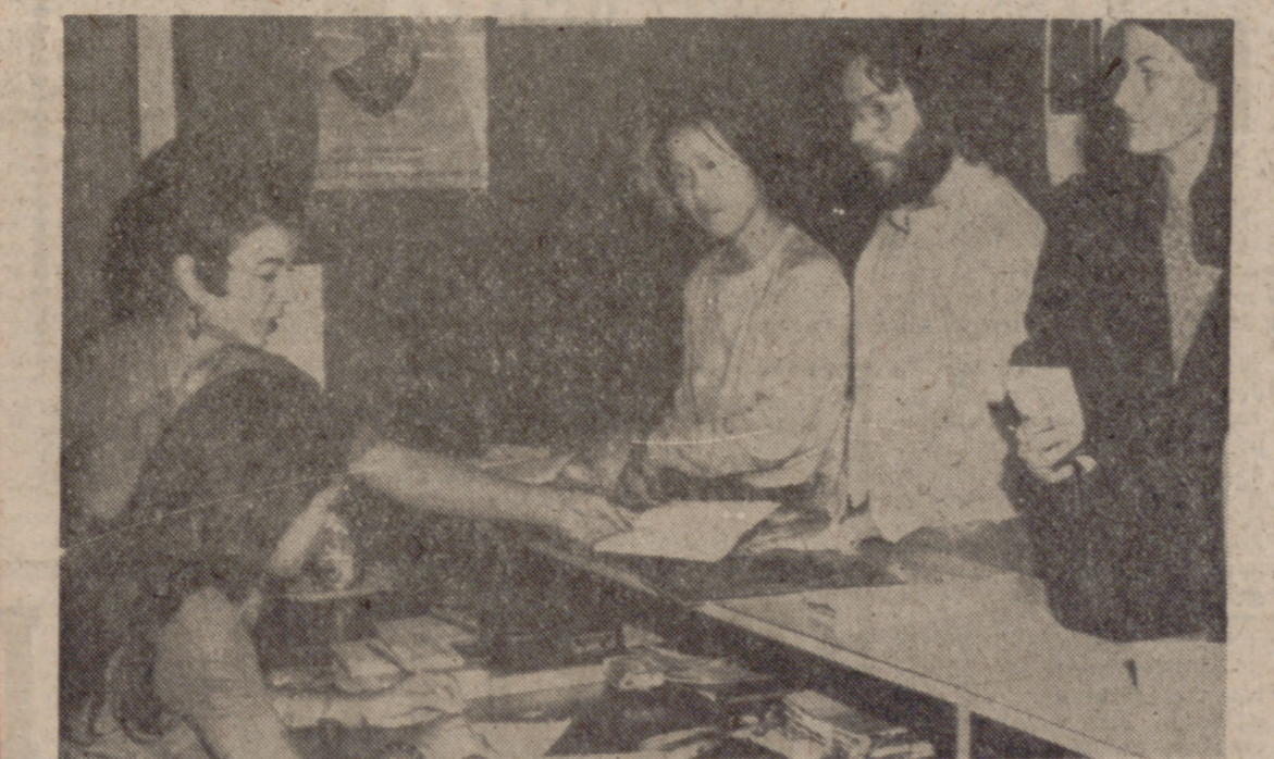
En favor del turismo universitario.

Más de cien mil jóvenes han pasado a lo largo del verano de 1972 por los campamentos de la Delegación Nacional de la Juventud, cifra que se alcanza por primera vez al cabo de treinta años y que demuestra el interés creciente de los españoles por la acción campamental como instrumento de formación política y ciudadana, así como el esfuerzo y trabajo constantes de la Delegación Nacional.