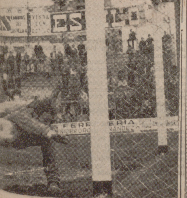
Varela, después de estrellarse en el poste —mostrando que recoge el grabado— fue a los pies de Escudero, que con tranquilidad envió a la red.

las dimensiones del campo, Ardoz se mostró muy incómodamente extrañados. Fero de cualquier manera incrementado sus esfuerzos. El partido, Ardoz se mostró muy incómodamente extrañados. Fero de cualquier manera incrementado sus esfuerzos. El partido, Ardoz se mostró muy incómodamente extrañados. Fero de cualquier manera incrementado sus esfuerzos.