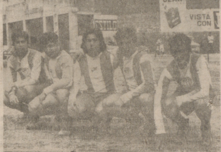
El quinteto atacante del C. D. Santa Teresa resolvió favorablemente su lucha con la zaga del Arces.

Interesante y competido partido el jugado por estos dos equipos, con un resultado final justo y emocionante por las alternativas del marcador.