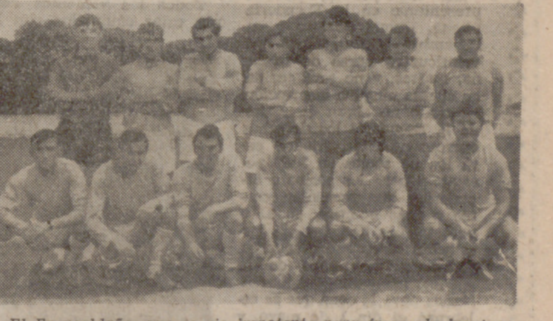
El Fuensaldaña, que se vio impotente para frenar la inspiración atacante de la U. D. Sur.

En el grupo tercero se lograron nada menos que 26 goles en cuatro partidos, lo que demuestra un poder ofensivo realmente extraordinario en los equipos que garantizaron la diversión a los espectadores.