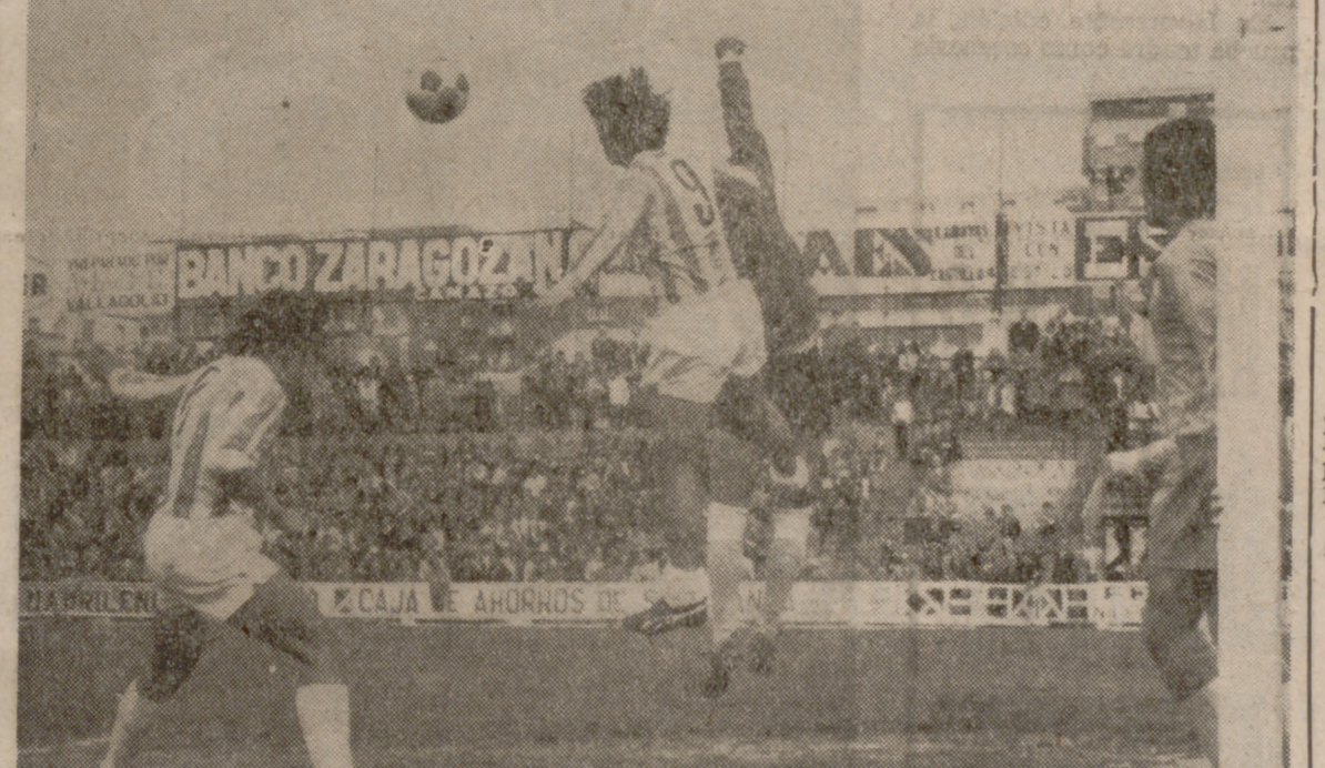
Alvarez y Tirone disputan un balón alto que acabaría despejando el meta iscarriense.

Alineaciones: G. E. Fasa: Barre; Espinilla,