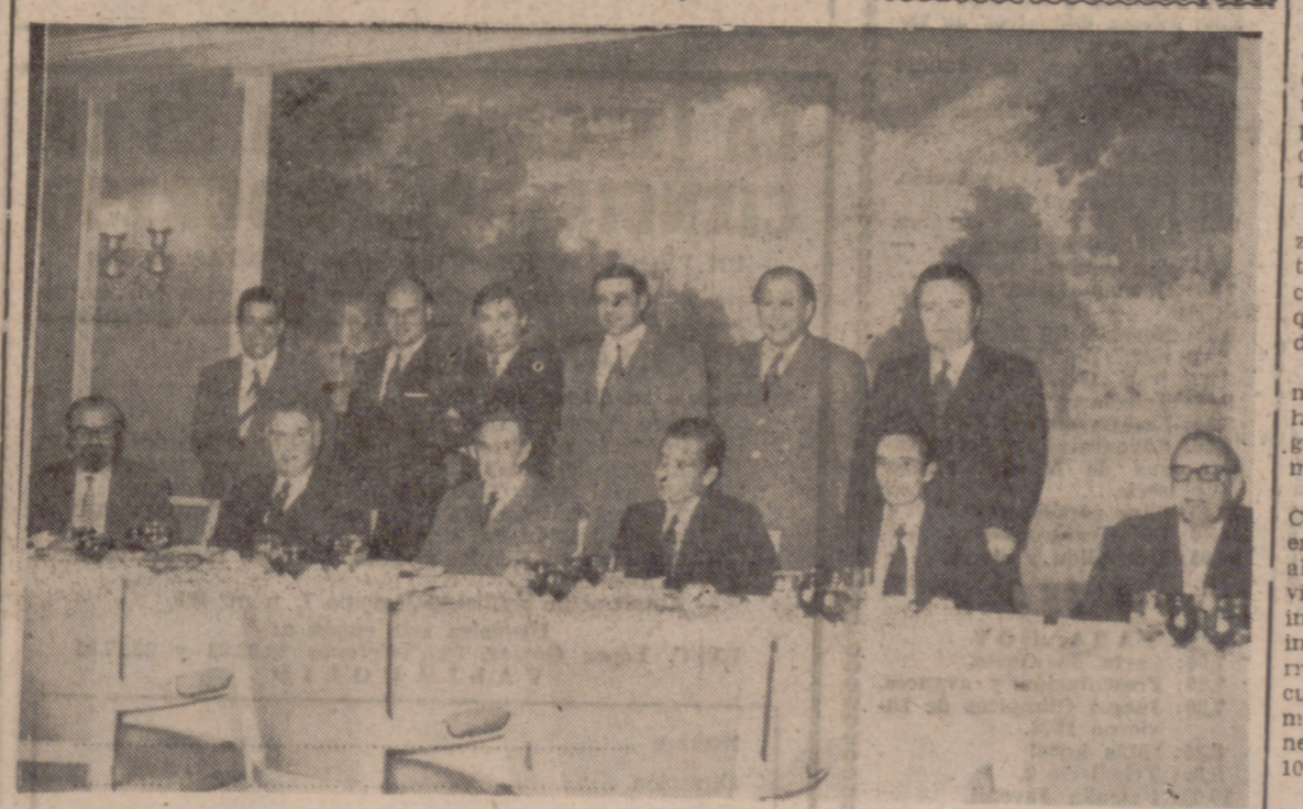
Anoche, en la parrilla del Hotel Conde Ansurés, los directivos de "Nestlé-Maggi" ofrecieron una cena a los directores de los diarios locales. Durante la misma se trataron diversos aspectos de la fábrica de Valladolid, así como de su futuro optimista, y se hicieron votos por la prosperidad y desarrollo de la importante factoría.