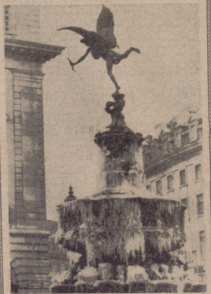
LONDRES.—La famosa estatua de Eros, en Piccadilly Circus, apareció con una gruesa capa de hielo. Gran Bretaña atraviesa ahora una ola de intenso frío que, según los meteorólogos, se prolongará durante algún tiempo.