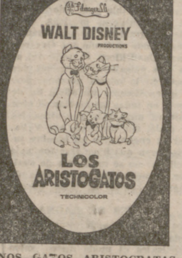
UNOS GATOS ARISTOCRATAS ALTERNANDO CON UN GATO GOLFO, EN LA MAS DESENRENADADA DANZA A RITMO DE JAZ