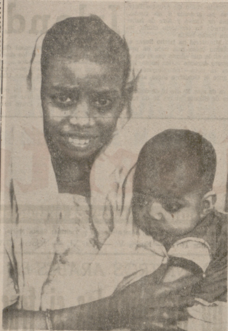
MIRPUR (Bangla Desh).—Esta joven madre espera, abrazada a su hijo, en el campo de Baharis, le sean entregados alimentos. El campo ha permanecido durante cinco días sin comida. Según informe, bengalíes, las personas cogidas estaban sometidas a morir de hambre bajo la acusación de colaboracionistas.

24.682.763.567 cigarrillos vendidos en los seis primeros meses del año