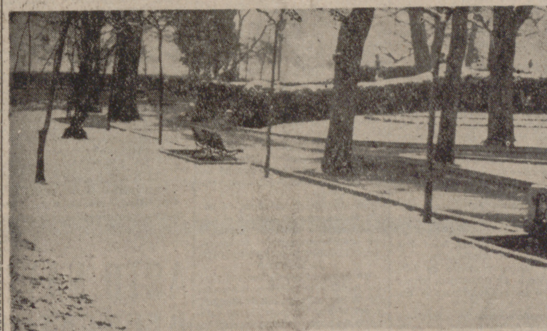
La nieve es noticia. Ha sido la primera nevada y hay que dejar constancia de ella con este documento gráfico y con estas líneas. Como algo ha salido el sol cuando el periódico esté en la calle será difícil que haya en alguna parte un recuerdo siquiera de esta nevada nocturna: la nieve ha fenecido. Pero para aquellos que no madrugaron, nuestro fotógrafo, Carvajal, ha captado esta postal del Parque del Poniente, solitario y blanco.