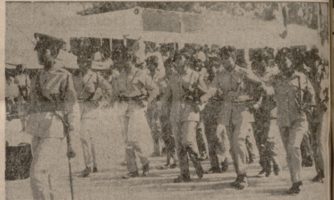
ADEN (Yemen).—Un grupo del Cuerpo Militar Femenino yemení desfila en El Shaab, durante los actos conmemorativos del octavo aniversario de la revolución del Yemen del Sur.