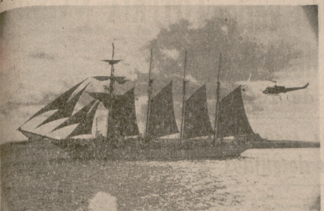
MADRID.—Ha salido del puerto de Cádiz el buque "Juan Sebastián Elcano", que inicia así un viaje de vuelta al mundo que no realizaba desde el año 1935, para conmemorar el histórico viaje de Magallanes y Elcano, siguiendo la ruta iniciada por el primero en 1522.