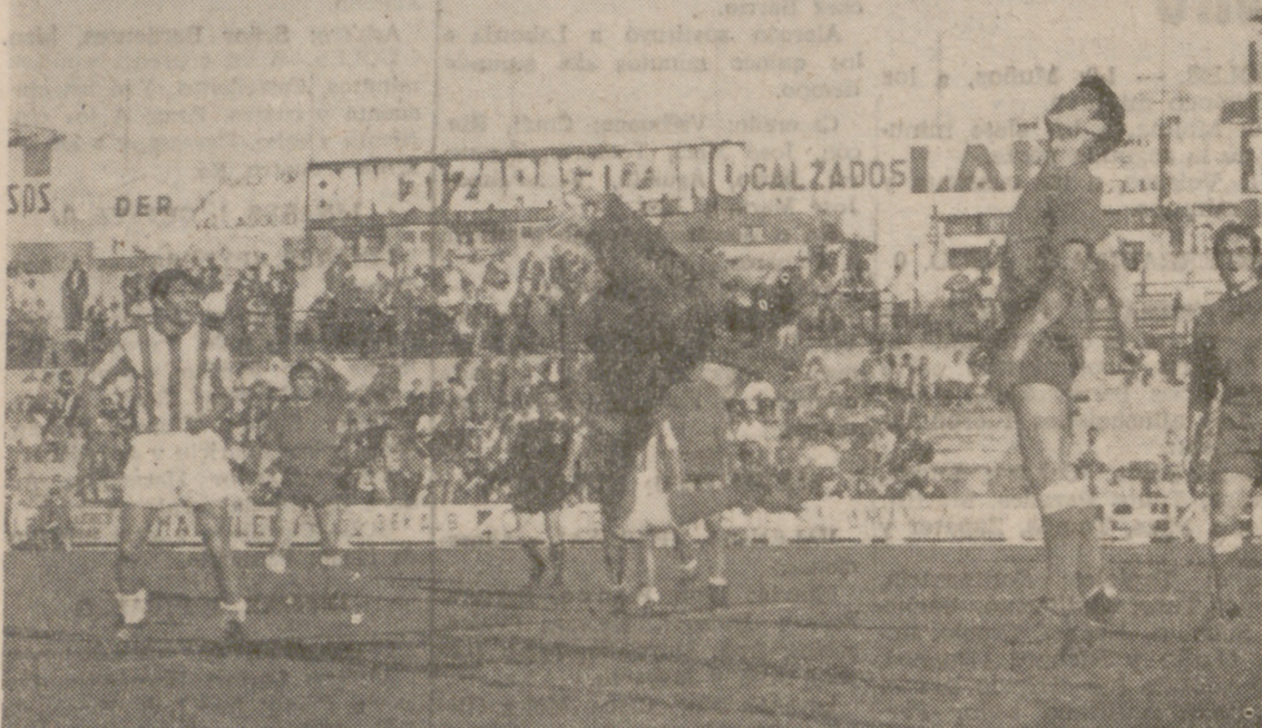
El meta bañezano fue la figura del encuentro, realizando paradas extraordinarias. Como muestra, basta un botón...

Con esta victoria, los vallisoletanos se colocan líderes invictos del grupo