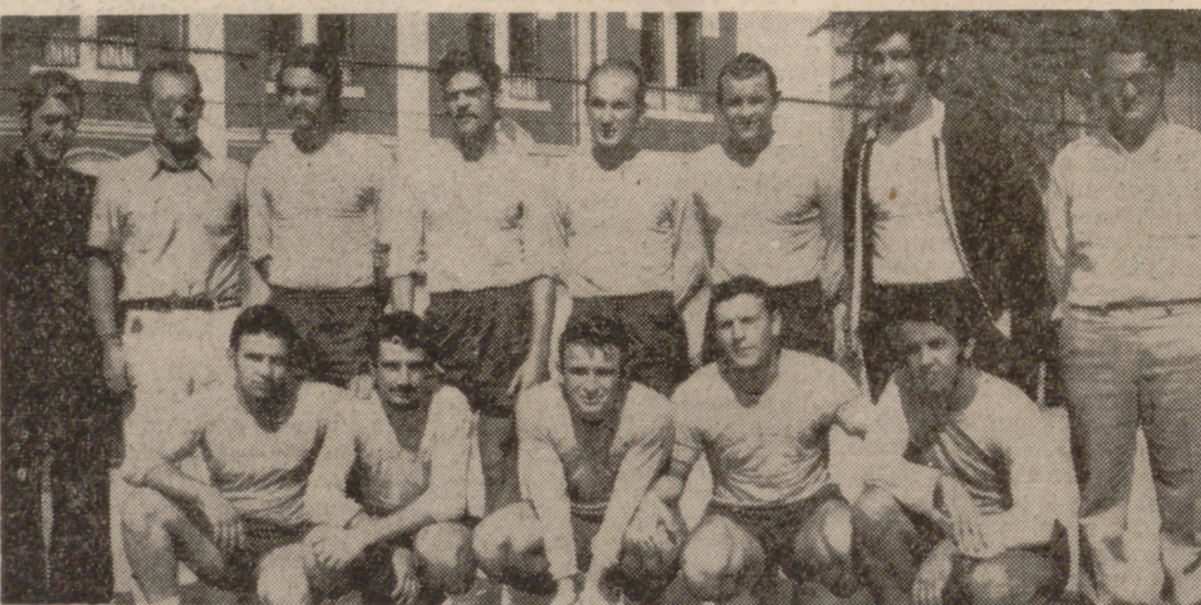
El Gaztelueta venía como favorito, pero salió derrotado. Los bilbaínos actuaron por debajo de lo esperado y fueron superados claramente por el San Carlos.