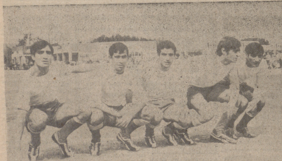
La delantera del Fasa no se estrenó en La Bañeza, y, en cambio, sufrieron cinco tantos en su red. Uno por cada delantero...

No tuvo complicaciones el Europa Delicias para hacerse con el triunfo y regresar de Zamora con dos valiosos positivos, ya que en todo momento su superioridad sobre el animoso e inexperto conjunto del Damm fue absoluta. Los vallisoletanos cuajaron una excelente actuación, sabedores de su claro dominio, y si no consiguieron más goles fue porque nunca pisaron a fondo el acelerador de su juego ofensivo. Gustó mucho el equipo blanquiverde en Zamora hasta el punto de que los propios aficionados de la vecina ciudad aplaudieron cariñosamente la brillantez del fútbol desplegado por los