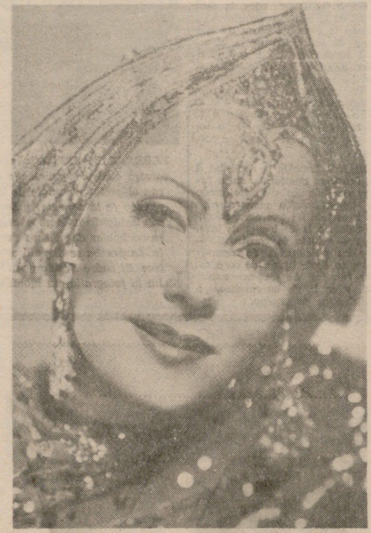
Greta Garbo, «La Divina», la máxima actriz de Hollywood y del cine universal.