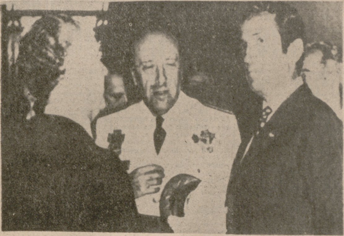
CARACAS.—El ministro venezolano de Asuntos Exteriores, Arístides Cavani (izquierda), con sus colegas españoles del Ejército, Juan Castañón de Mena, y de Asuntos Exteriores, Gregorio López Bravo, quienes visitan oficialmente Venezuela, durante la visita de éstos al panteón donde reposan los restos de Simón Bolívar.