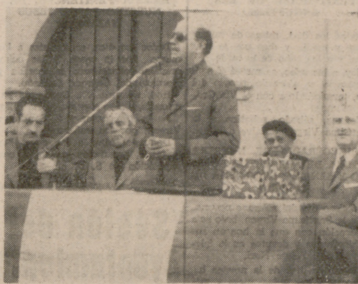
El Gobernador Civil y Jefe Provincial, en la clausura de la Cátedra en la Unión de Campos.