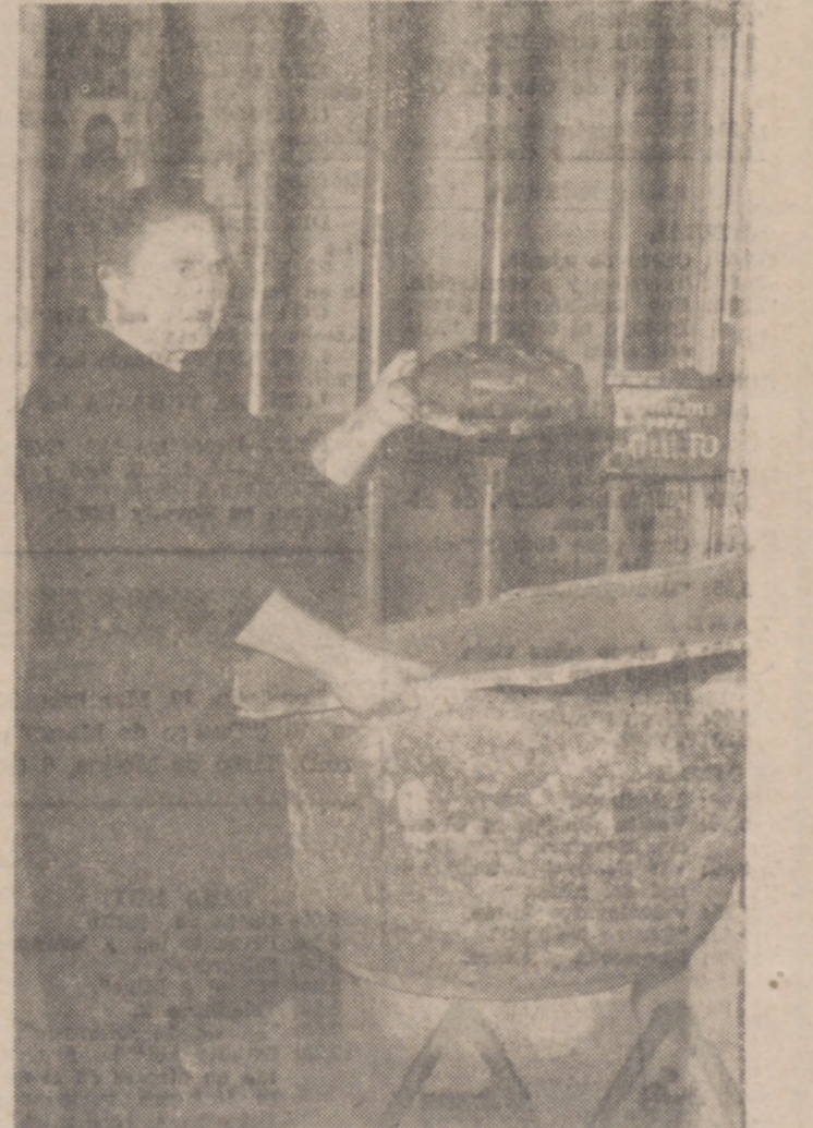
Una vecina de Morales de Campos, muestra una de las tablas arrancadas.