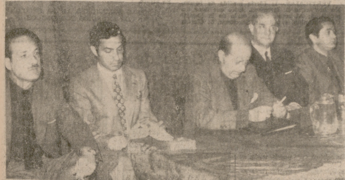
PRESIDENCIA DEL ACTO