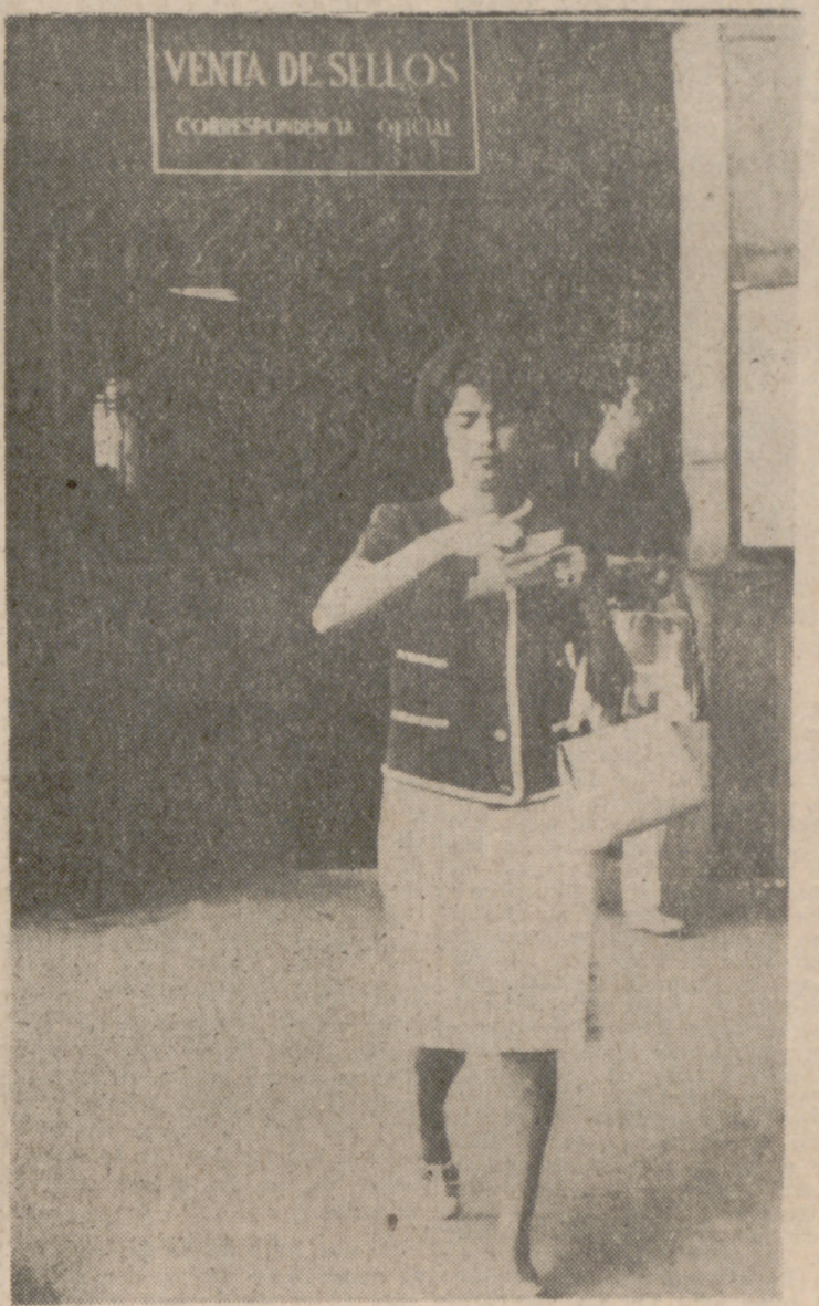
Un documento oficial de la mayor urgencia tardaba, en los siglos XV y XVI, casi un mes en llegar desde La Haya a Roma. Ese mes se ha reducido hoy a horas gracias a unas conquistas científicas y a una organización mundial que atiende a la «urgencia» como factor primario de los tiempos actuales.

Al socaire de ese signo de la velocidad y del vértigo que parece formar y conformar alguna de las características más determinantes de la sociedad de nuestros días, los españoles desde el pasado enero, cuenta con un nuevo servicio de urgencia de Correos. Se trata de la posibilidad de recoger a la llegada de la misma estación, aeropuerto, estafeta u oficina de Correos, previa identificación, la correspondencia emitida con el franquico denominado «urgencia especial», franquico que traducido en sellos, asciende exactamente a un valor de quince pesetas, cinco más que la urgencia normal que, en igual fecha quedó en diez pesetas.