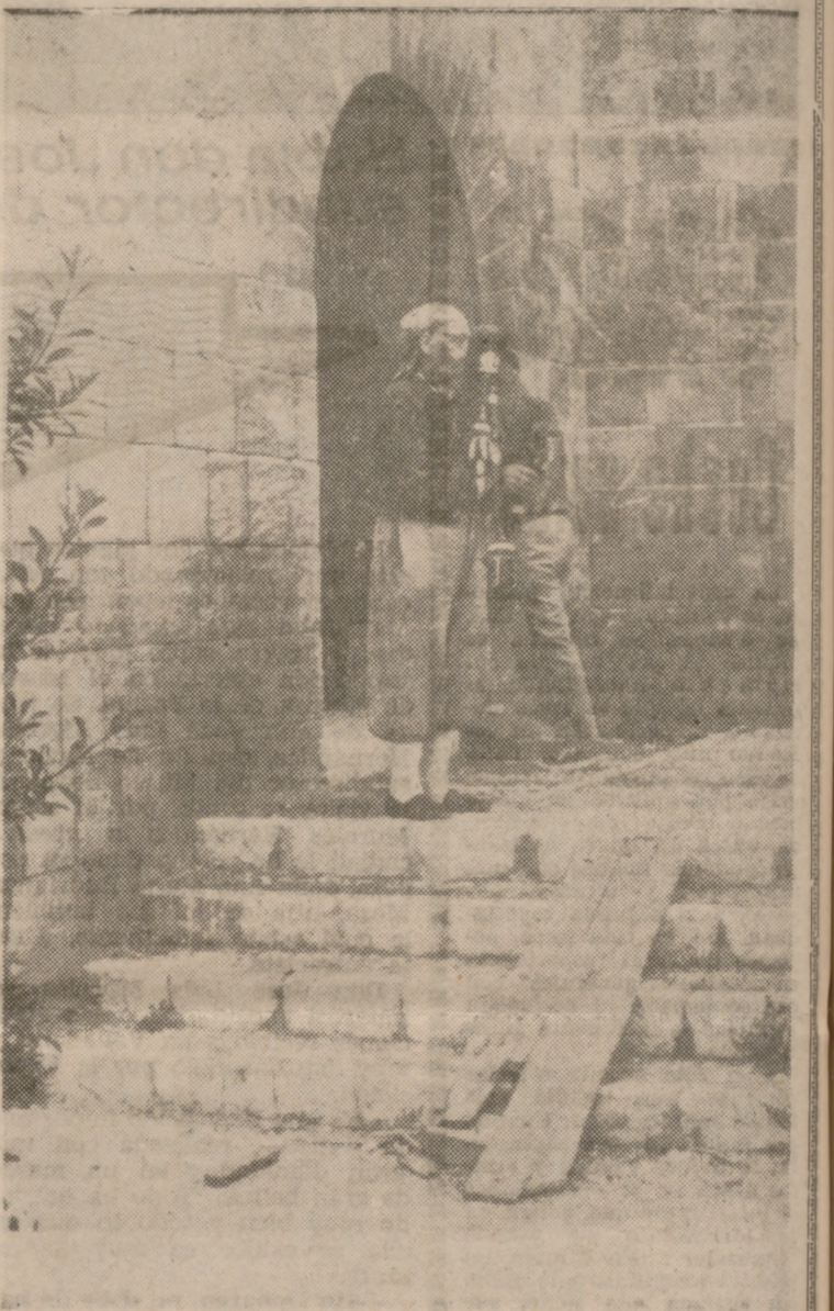
En la Menestría del Vidrio se recibe un viejo "missatge" haciendo una chirimia.

Las fábricas no escapan a la ordenación turística. En Mallorca se visita la más caracterizada productora de perlas artificiales, discurriendo por un pasillo que bordea las diferentes salas —no picture— en que se realizan las operaciones indus-