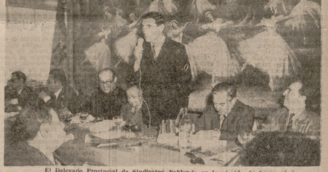
El Delegado Provincial de Sindicatos, hablando en la comida de hermandad.