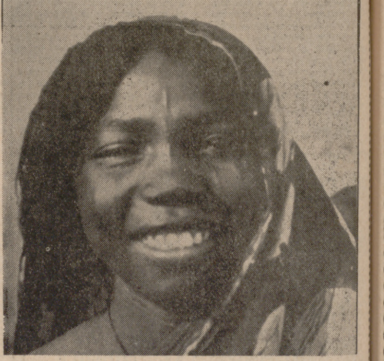
Los ta'ujes constituyen el distintivo tribal.