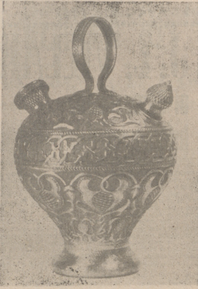
La cerámica, con sus infinitas variedades en cuanto al procedimiento de fabricación, al decorado, a la forma, es uno de los más importantes y valiosos aspectos de la artesanía española.