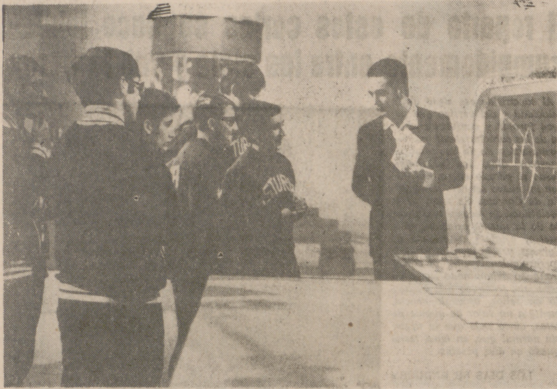
Un plano del popular espacio televisivo "Cesta y Puntos".

Una cosa es el memorismo y otra el uso racional y ponderado de la memoria