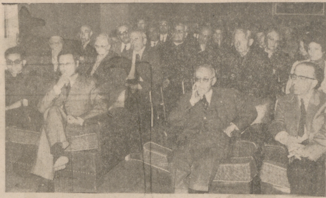
Un grupo de asistentes a la conferencia.