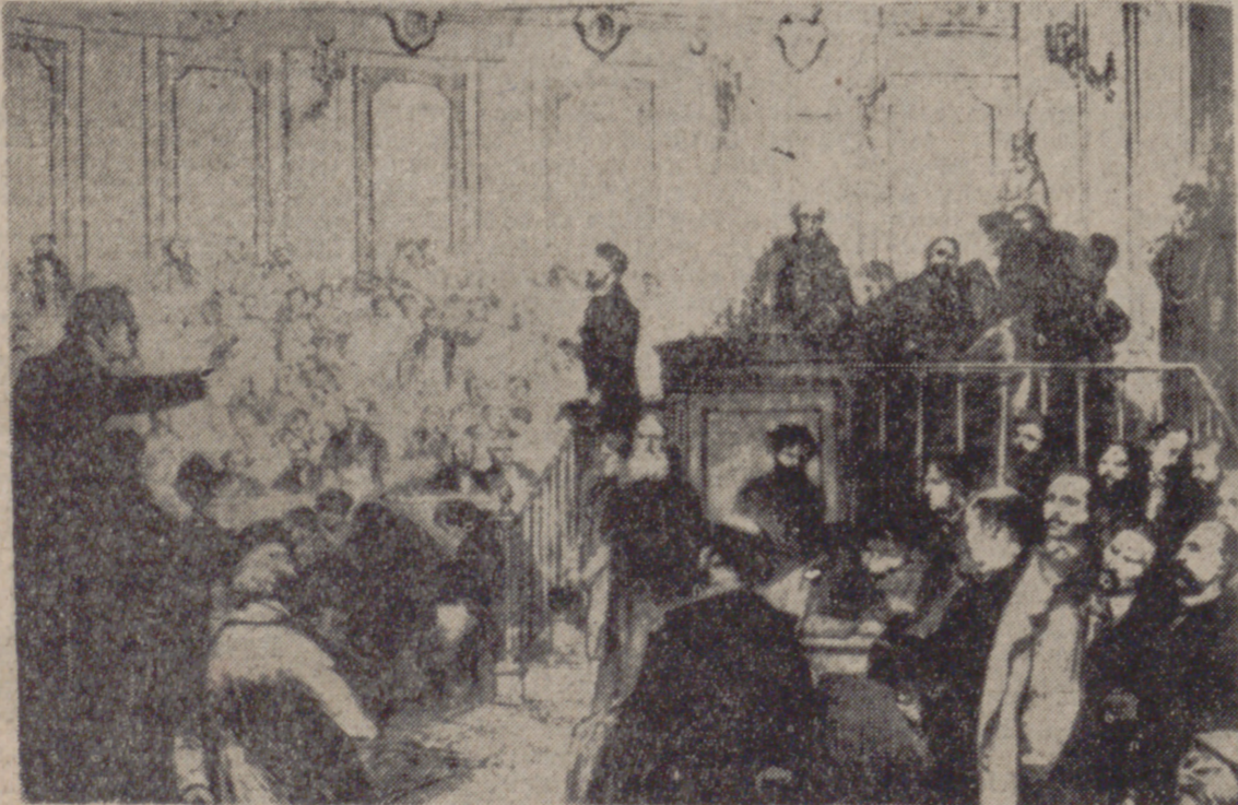
Contraste de pareceres en el Congreso.