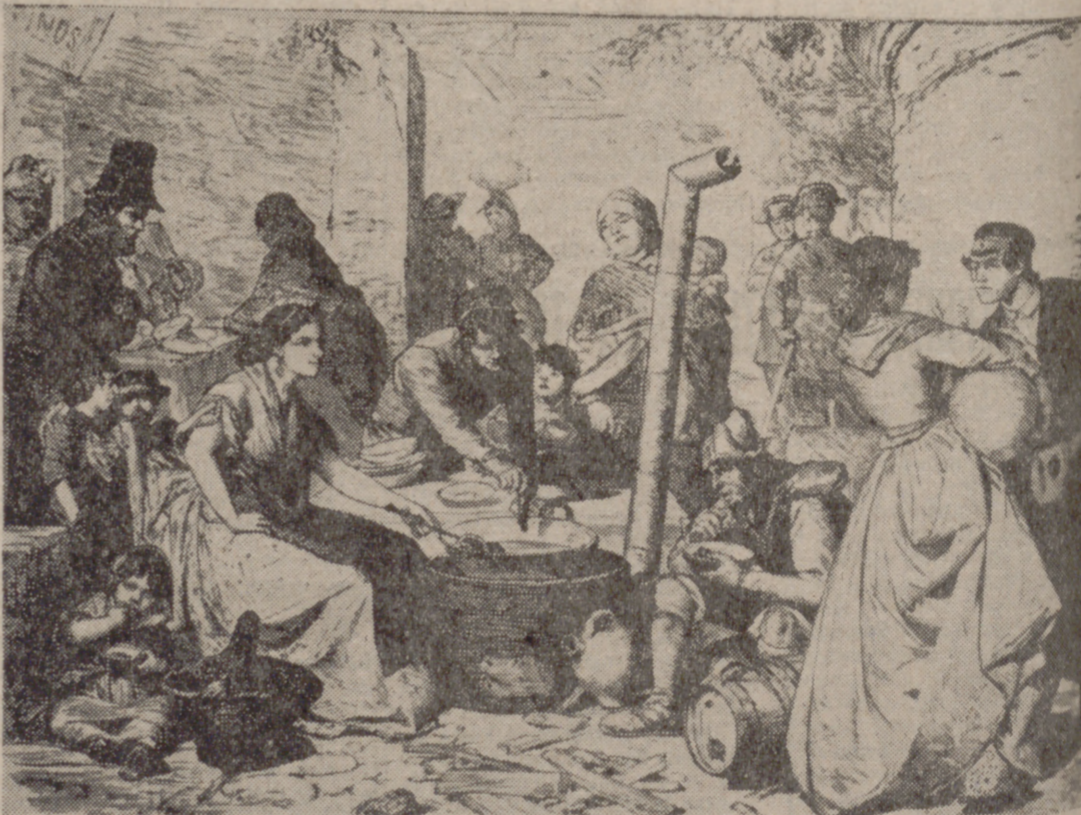
Aquel Madrid, colorista y agarbanzado, de 1870.

"Un Ministro de la Gobernación tan tirano como cobard, que no tiene el valor del progreso ni de la reacción; apostata y traidor por temperamento, que vendió la República Española por un cuartillo de vino..."