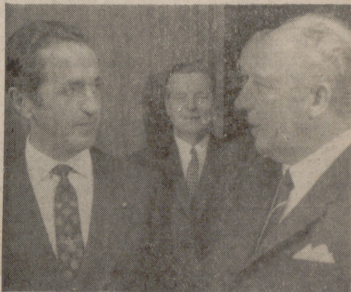
BONN.—Tres momentos de la visita del ministro español de Asuntos Exteriores, don Gregorio López Bravo, a Bonn. En las fotografías aparece en las visitas realizadas al Presidente alemán, Heinemann; al canciller, Willy Brandt, y a su colega Scheel.