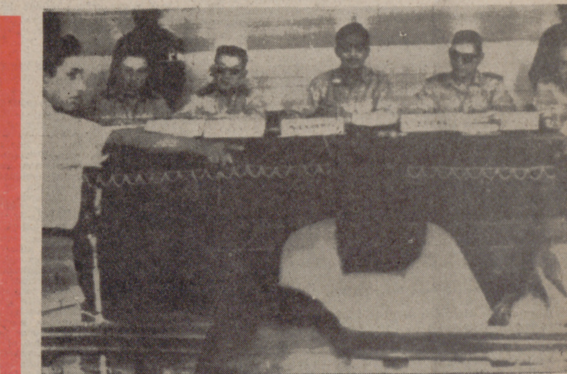
Hace más de tres años, todos los periódicos publicaron esta fotografía. Corresponde a un momento del juicio celebrado contra Regis Debray en Bolivia y en el que el francés fue condenado a treinta años de cárcel, acusado de participar en las guerrillas comunistas.

Estaba condenado a treinta años por su actividad guerrillera en Bolivia