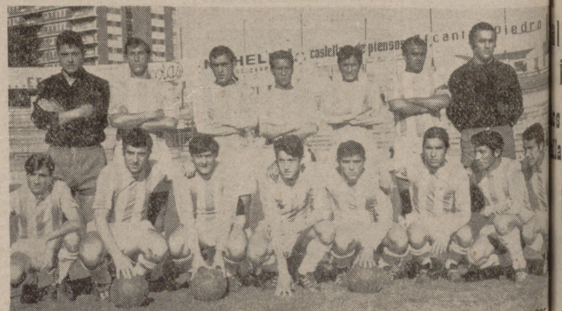
Una de las formaciones iniciales del Europa Delicias. El equipo se ha acoplado perfectamente y ayer no mereció la derrota ante el Zamora, uno de los “galillos” de la competición.

La parcial actuación del árbitro perjudicó a los vallisoletanos