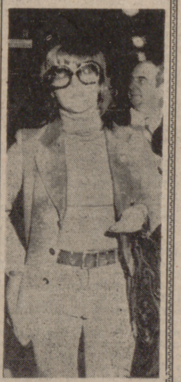
CLEVELAND (Ohio). — La actriz Jane Fonda, acompañada de su abogado, Mark Lane, se declaró inocente en cuanto a las acusaciones de contrabando de unas inidentificadas piladoras en los Estados Unidos y de asalto a un policía de Aduanas en el aeropuerto de Hopkins el día 3.