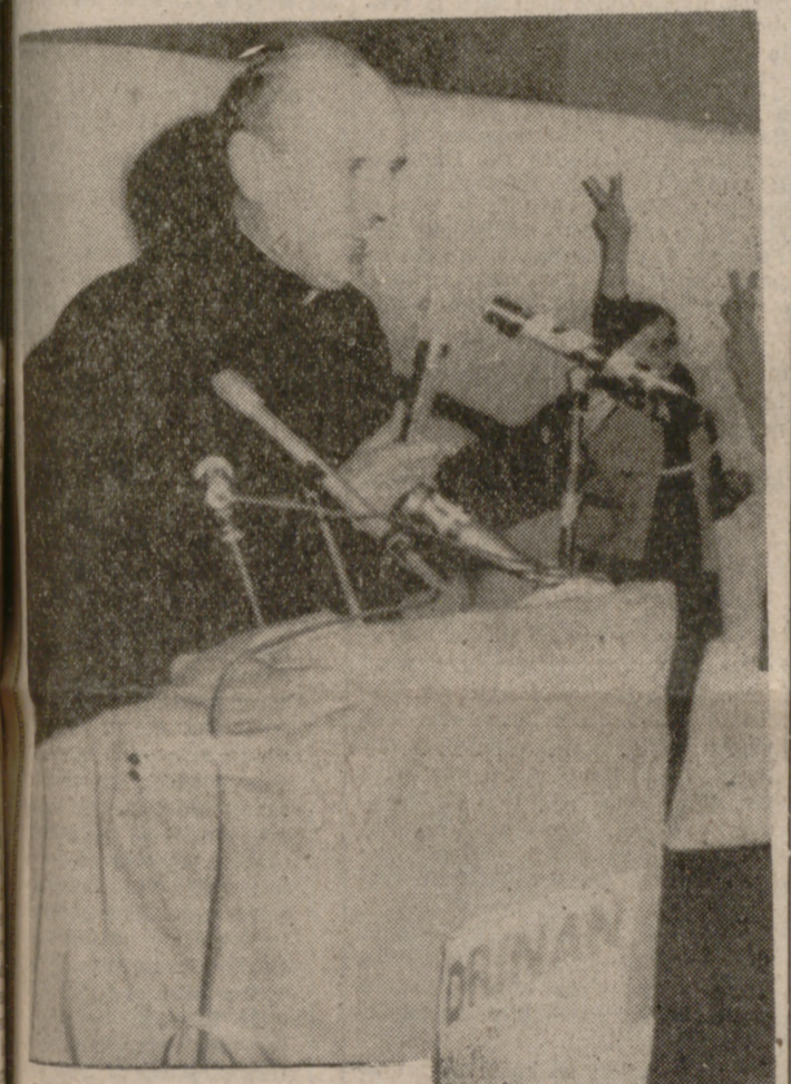
NEWTON (Massachusetts). — El padre Robert F. Drinan sonrió al dirigirse a sus partidarios después de haber sido elegido miembro del Congreso en las elecciones del día 3. Es demócrata y el primer sacerdote de la Iglesia Católica elegido miembro de dicha Cámara.