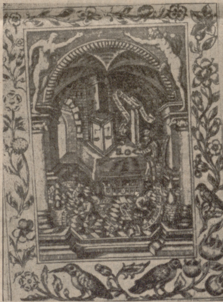
El alquimista inglés Tomás Norton, en su laboratorio.

El rigor científico de las manipulaciones alquímicas de Geber le llevó a mencionar el empleo del dióxido de manganeso en la fabricación de vidrios; cómo concentrar el ácido acético mediante vinagre destilado, y la manera de realizar una calcinación, una cristalización y una sublimación y reducción de sustancias.