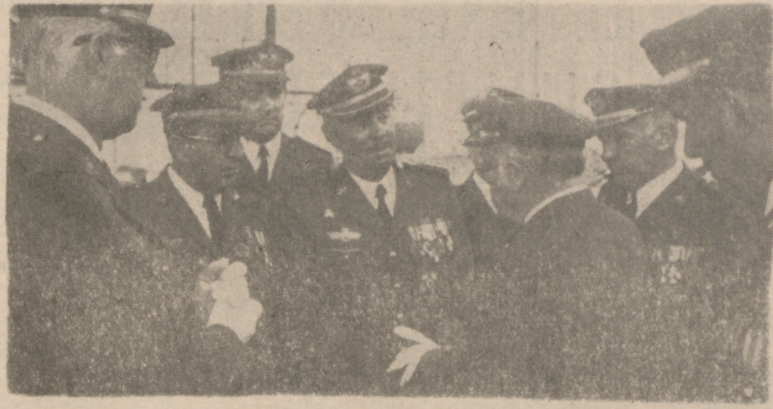
UN MOMENTO DE LA VISITA (INFORMACION EN LA PAGINA SIGUIENTE)