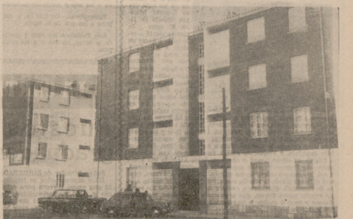
GRUPO DE VIVIENDAS EN PENAFIEL

Ayer, a las doce y media, en el salón de actos de la Delegación Sindical Comarcal de Peñafiel y con la asistencia de numerosos vecinos, se celebró el sorteo de 52 viviendas, 45 del Grupo A y 7 del Grupo B, construidas por la Obra Sindical del Hogar.