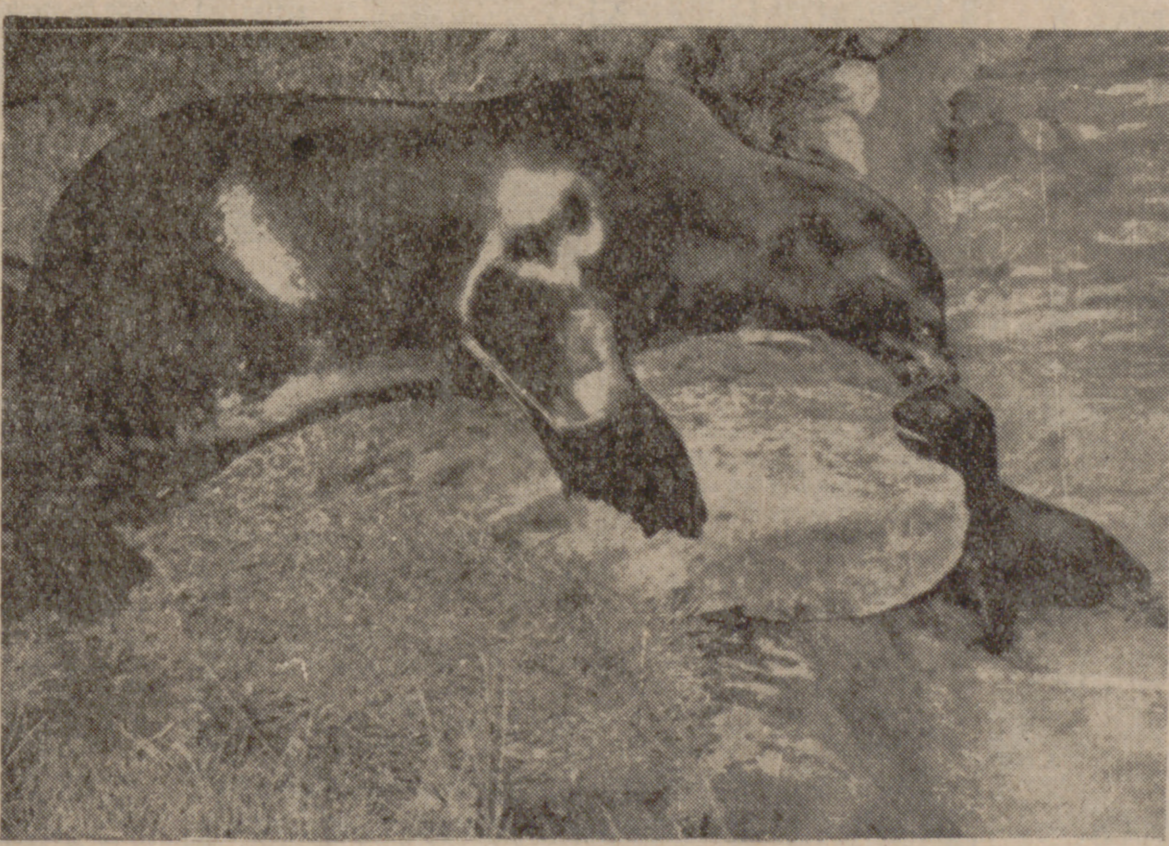
LA PEQUEÑA Foca, INDECISA

Afirmó, además, que logró traducir el significado... ...de un coloquio, y hasta que era capaz de expre... ...sarse como ellos. Para lo cual grabó varios disc... ...os con supuestas pláticas entre los michinos. ...Muchos han sido los naturalistas que se sien... ...nen la idea de que algunos animales se expresan... ...en un lenguaje que, claro es, nada tiene que ver... ...con el de los humanos. Charles Cornish llamó... ..."poliglota" al perro, pues según él, no sólo en... ...tiende el idioma de su amo, sino también el de... ...otros países. ¡Infiere en ello la expresión, el... ...tono, la modulación de las palabras? ...El norteamericano Gardner estudió durante... ...años a los monos del entonces Congo francés y... ...apuntó a este respecto: "En el lenguaje del mo... ...no, "oogk" significa atención y "onay" quiere de... ...cir agua. Algunos sonidos emitidos por el chimpan... ...cú sobrepasan la capacidad de la mente huma... ...na." Gardner llegó a aporlar un vocabulario... ...singularísimo y bastante completo—siempre se... ...gún él—para seguir el curso de una conversación... ...entre simios.