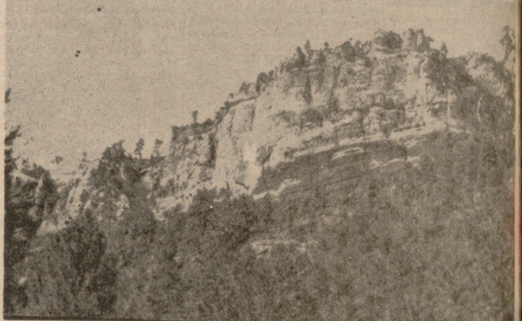
Parque Cinegético Experimental de "El Hosquillo".

Entre otras especies, acoge al ciervo, corzo, gamo, muflón y oso