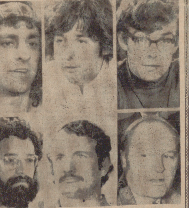
CHICAGO.—Han sido declarados culpables cinco de los siete encartados en el juicio llamado "los siete de Chicago" y a causa de los disturbios que se registraron en dicha ciudad en agosto de 1968, cuando la celebración de la convención demócrata. El Jurado falló que cinco de ellos habían cruzado las líneas de seguridad para iniciar a los disturbios. De arriba abajo y de izquierda a derecha: Jerry Rubin, Abbie Hoffman, Thomas Hayden y Rennie Davis, Lee Weiner, John Froines y David Dellinger. De estos siete han sido declarados culpables Dellinger, Rubin, Hayden, Hoffman y Davis.

PUNTUALIZACIONES En Bonn se ha aceptado la invitación, pero al mismo tiempo se han puesto los puntos sobre las íes al viaje de Brandt. Por parte gubernamental se ha acompañado la noticia de una explicación: Pankow se hace falsas ilusiones si cree que el Canciller viajará a Berlín oriental para firmar el tratado de reconocimiento, cuyo proyecto fue enviado