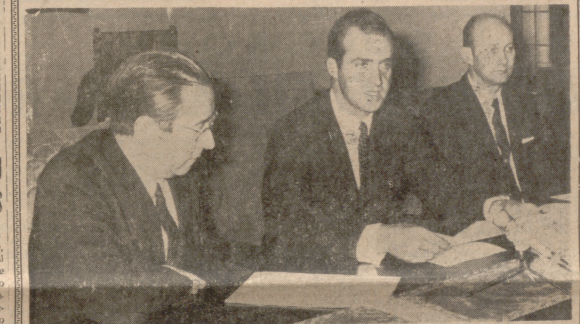
TOLEDO.—El Príncipe de España, don Juan Carlos de Borbón, ha inaugurado el Palacio-Museo de Fuentelida como sede permanente del Consejo de Rectores, alto órgano consultivo universitario. Iba acompañado del Ministro de Educación y Ciencia y del Subsecretario del Departamento y asistió el Cardenal Primado, que recibió al Príncipe a la entrada del Palacio.