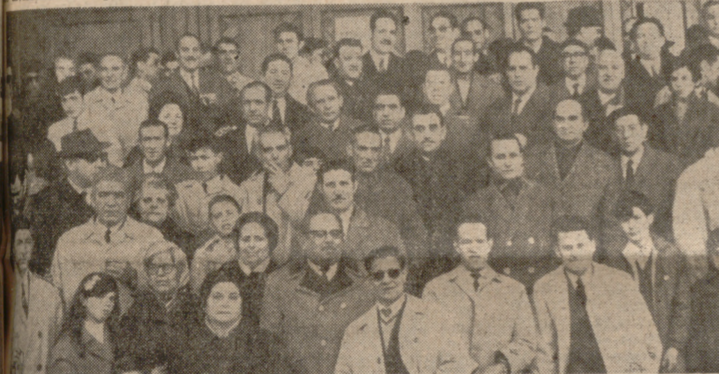
ASISTENTES A LOS ACTOS

El transcurso de la última contienda mundial. Dieron comienzo los actos con una misa a las diez y media, en la Basílica Santuario de la Gran