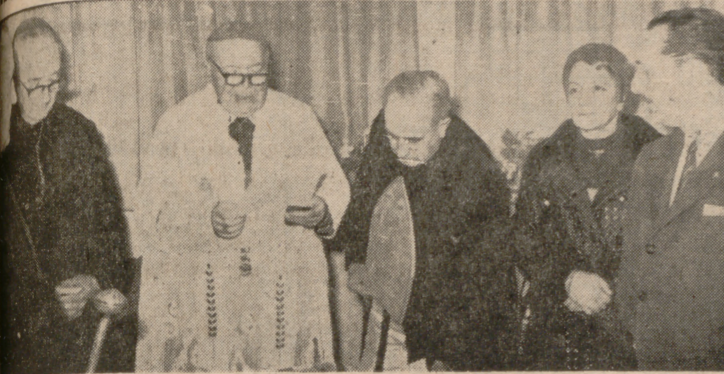
EL OBISPO DE PALENCIA, BENDICIENDO LA NUEVA CASA