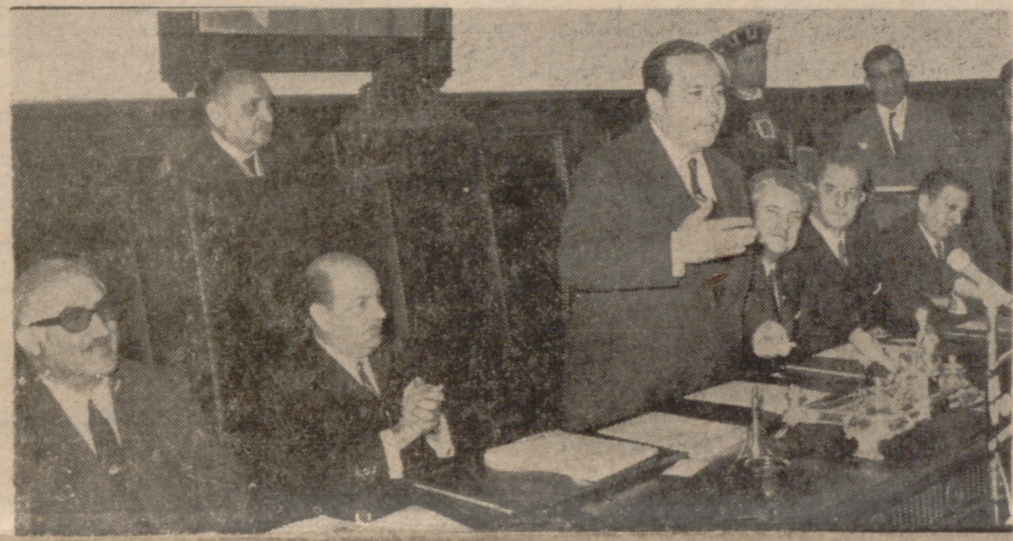
EL MINISTRO, HABLANDO EN LA REUNION DE LA C. I. T. E. (INFORMACION EN PAGINA SEXTA)

Por parte española.—Portahelicópteros "Dédalo", con unos veinte helicópteros antisubmarinos de la primera, segunda, tercera y cuarta escuadrillas. Buque insignia del contralmirante Pery, jefe del mando de escoltas, que tendrá el mando del ejercicio. 51 escuadrilla de fragatas: "Vicente Yáñez Pinzón", "Legazpi", "Júpiter", "Vulcano" y "Limiers". Petroleros: "Telde". Aviones de los escuadrones 201 y 206 del Ejército del Aire, con base en el aeropuerto de Labacolla, de Santiago de Compostela.