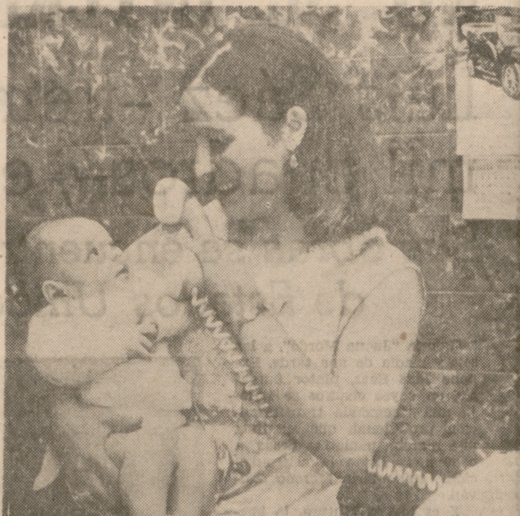
El teléfono alcanza a todos, incluso a los niños, aunque el caso de la fotografía sea algo exagerado. Pero los crios se familiarizan con los teléfonos e incluso tienen el suyo propio, de juguete.

—¿Quiere esto decir que no será instalado ningún teléfono más? —Los normales por las bajas que vayan produciéndose, pero nada más. —¿Y hay muchas peticiones pendientes?