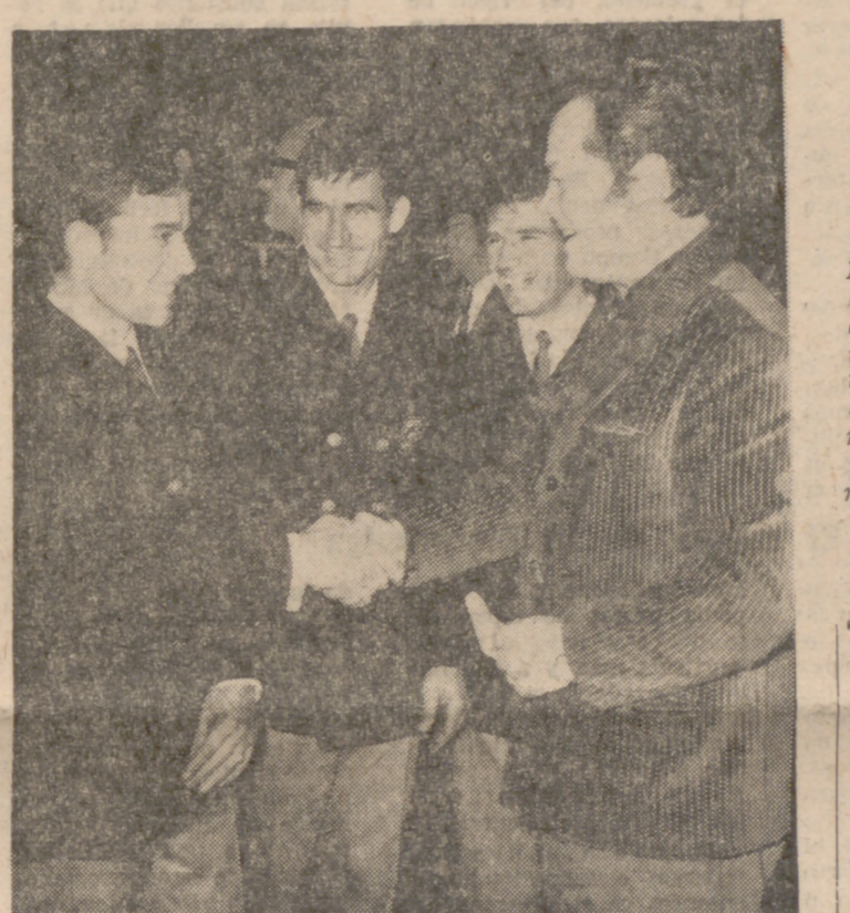
MADRID.—El equipo español de ciclismo que correrá la Vuelta a Tachira, en Venezuela, con un recorrido total de 1.383 kilómetros, ha salido del aeropuerto de Madrid-Barajas rumbo a Caracas...