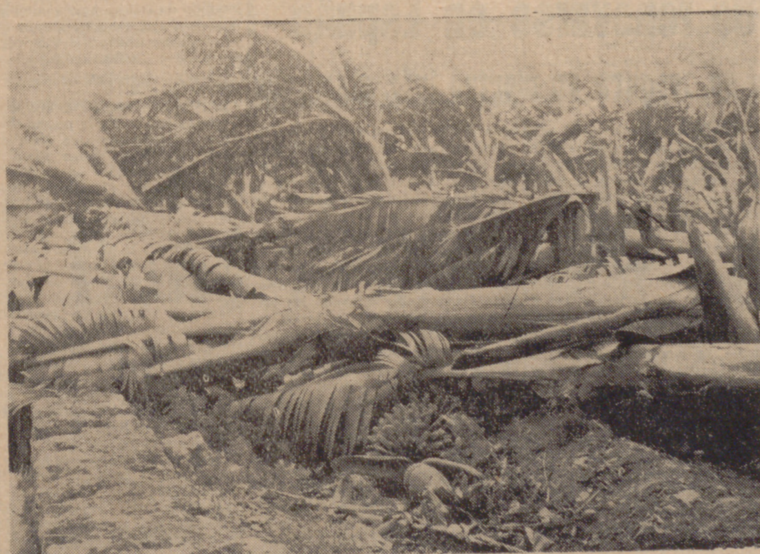
LAS PALMAS DE GRAN CANARIA.—He aquí una vista de los destrozos causados por el furioso vendaval que ha azotado las Islas Canarias el pasado fin de semana. Gruesos árboles, plataneras y otros cultivos, quedaron dañados por la fuerza del viento y abatidos, siendo causa del corte de algunas carreteras.