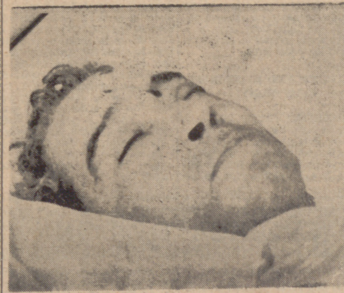
MALAGA.—El famoso actor del cine, teatro y televisión, Antonio Martelo, que popularizó últimamente el personaje de "El Seneca" en la pequeña pantalla, que ha muerto a consecuencia de un accidente de automóvil, a pocos kilómetros de Malaga. El popular actor, en su lecho de muerte.