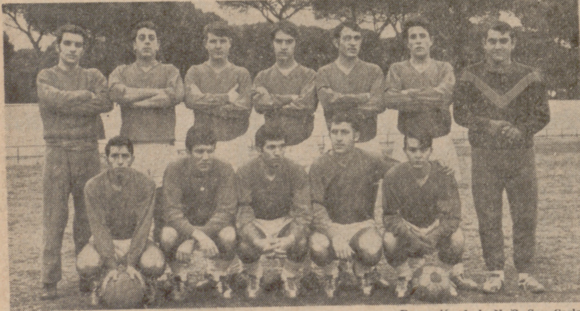
Formación de la U. D. San Carlos, que ayer empató con el Girón.