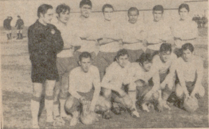
El Iscar volvió a ganar con autoridad, esta vez ante la Ferroviaria.