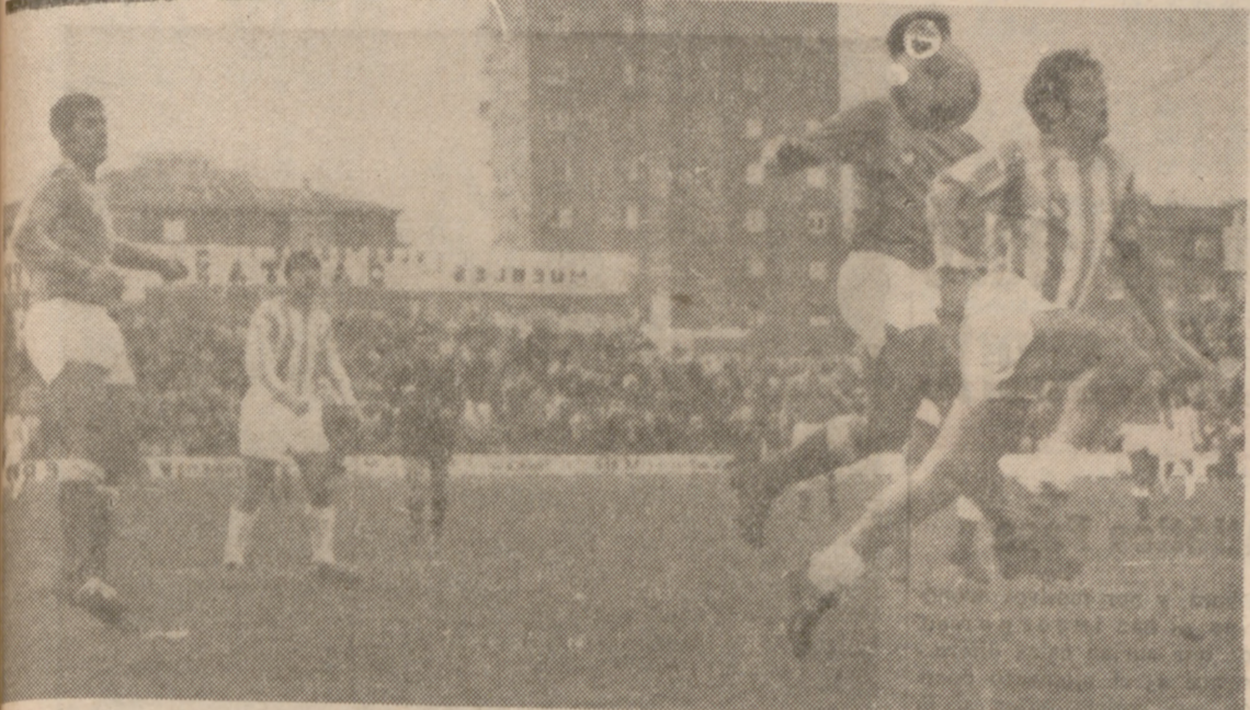
IMPETU.—Lusa, tras superar unos comienzos flojos, fue un jugador todo impetu y entusiasmo fue a todos los balones, aunque tuviera poca suerte, como en esta ocasión, en que no alcanza, por milímetros, este balón centrado por Sahr.

El piloto italiano Roberto Maurrelli ha establecido dos nuevos récords mundiales de motonáutica en la categoría de motores de competición de 500 kilos: el de fondo, sobre la distancia de 24 millas marinas, y el de la hora plusmarca esta que ya le pertenecía a Maurrelli. Las 24 millas marinas fueron recorridas por el piloto italiano en 17 minutos, 54 segundos y 9 décimas, a una media de 148,862 kilómetros por hora (récord anterior 135,080 kilómetros por hora), mientras que en la hora cubrió una distancia de 133,344 kilómetros (su récord mundial anterior: 126,250 kilómetros).