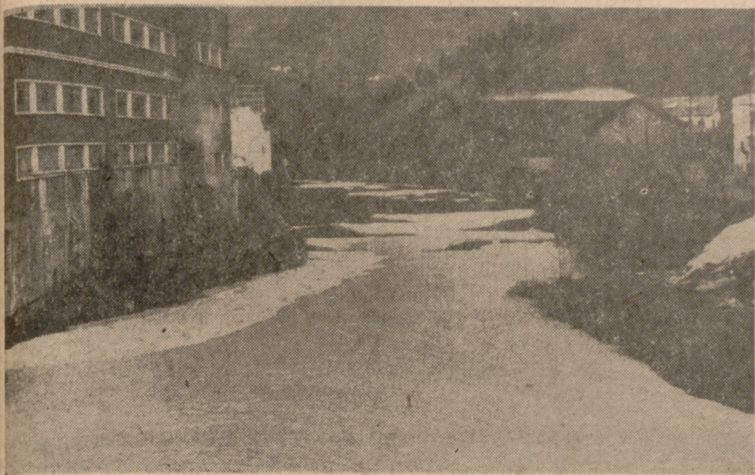
Impresionante espectáculo que ofrece uno de nuestros rios del Norte, víctima de los vertimientos industriales.

La trucha y el salmón son las especies más sensibles a sus efectos