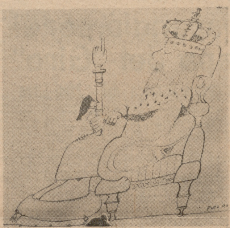
LA OPOSICION A LA MONARQUIA