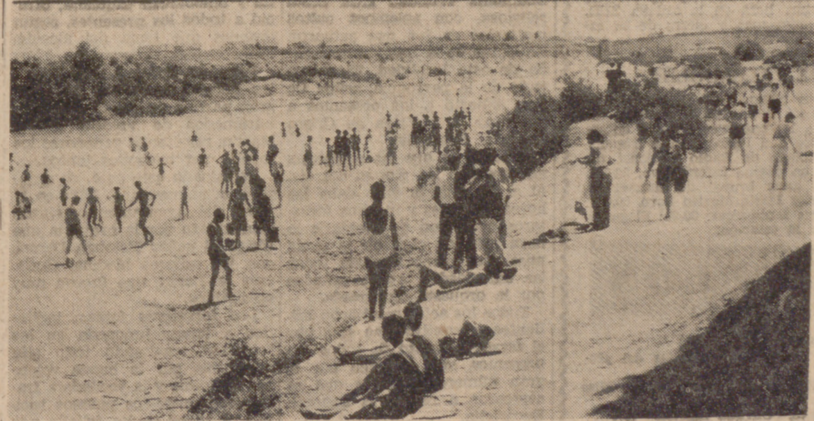
Playa de Puente Duero.

Si la actividad solar de este año nos lo permite, posiblemente podamos disfrutar de algunos días verdaderamente estivales, allá a finales de este mes, y, si hay suerte, se prolongarán hasta el de agosto. Y como todo depende de la actividad solar, los comercios se refugian cada vez más en la exhibición de modas de verano, tanto para caballero como para señora, y si lo han hecho ha sido timidamente, dedicando breves espacios en los escaparates. Ellos, los comerciantes, vienen a ser el termómetro que marca el tiempo del que vamos a poder gozar, y este año parece que las cosas andan mal por cuestión de las llamaradas que de vez en cuando se desprenden del astro rey. De no haber de no existir esas llamaradas, la moda de verano estaría exhibiéndose desde el mes de marzo o abril, como viene siendo habitual el resto de los años.