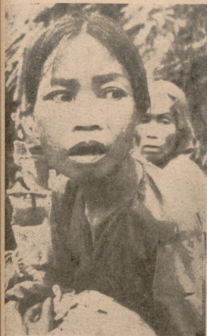
TAM KY (Vietnam del Sur).—Todo el horror de la guerra aparece reflejado en el rostro de esta madre que da protección a su hijo durante la "Operación Lamar Plain", del Ejército norteamericano.