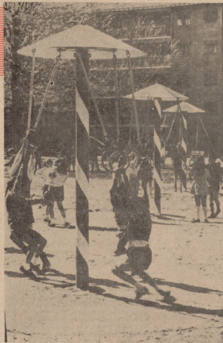
De la casa de corredor al piso soleado con terrazas. De la calle o los patios de vecindad a un sitio al aire libre para jugar.

La casa de los padres del hombre del campo había sido dirigida por el albañil del pueblo, que ni a maestro de obras llegaba. Tenía dos pisos. Del