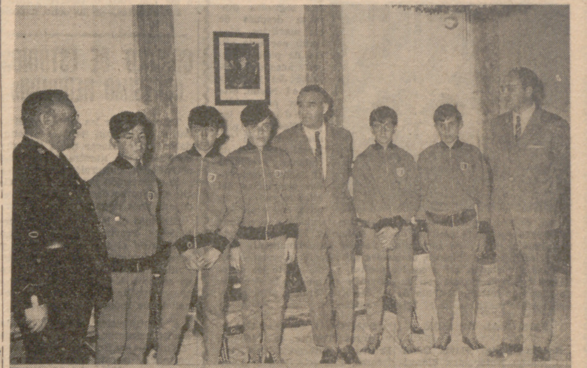
El Gobernador y el Jefe Provincial de Tráfico, con el equipo infantil.

Ayer a primeras horas de la tarde, el Gobernador Civil y Jefe Provincial del Movimiento recibió en su despacho a los miembros que componen el equipo infantil de tráfico que representará a nuestra ciudad el día 17 en el campeonato de España a celebrarse en Madrid.