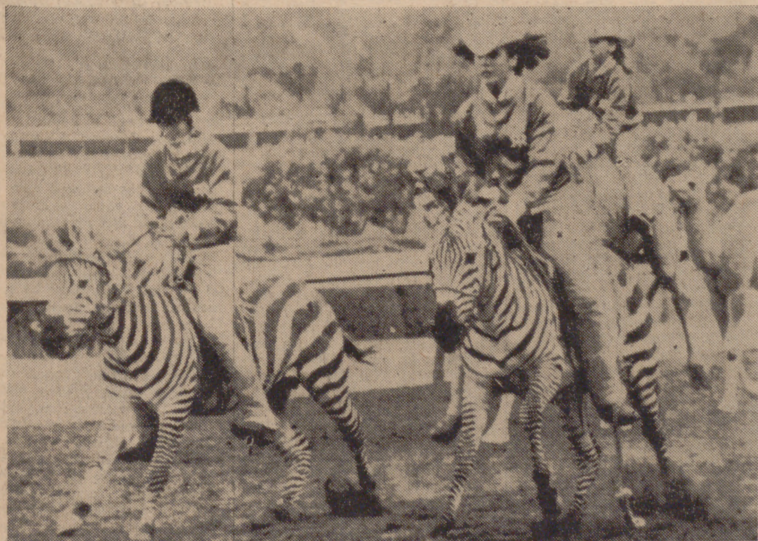
INGLEWOOD (California).—Más de cuarenta mil personas han asistido a una singular carrera de animales de las más distintas especies, tales como cebras, elefantes, camellos, cabras y burros, en el Hollywood Park. En la foto, un grupo de jinetes femeninos en tan singular carrera "salvaje".