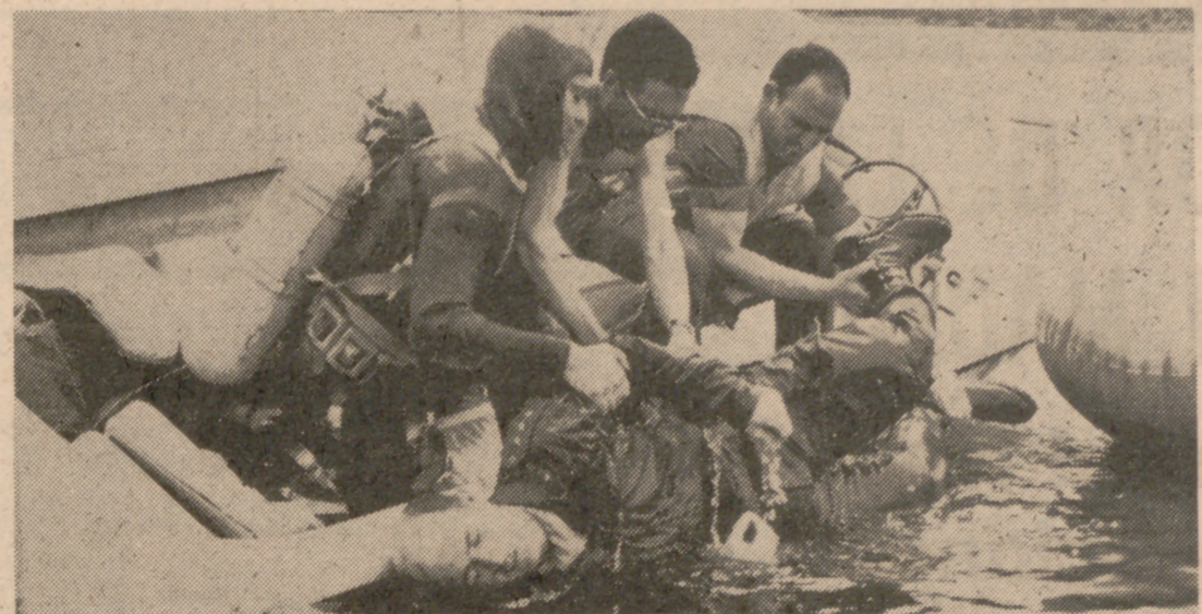
GUADALIX DE LA SIERRA (Madrid).— Los hombres-rana de la Base naval de Cartagena han logrado rescatar los tres cadáveres de los tripulantes del helicóptero militar que se precipitó en aguas de la presa del Vellón. En la foto, un momento del rescate del cadáver del capitán don Luis Ferro Ruiz de la Prada.