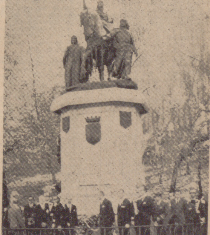
MADRID.—El ministro de Asuntos Exteriores de la Argentina, don Nicanor Costa Méndez, depositó una corona de flores ante el monumento a Isabel la Católica, acompañada del embajador de su país en España, don César Urien, y otras personalidades, momento que recoge la foto.