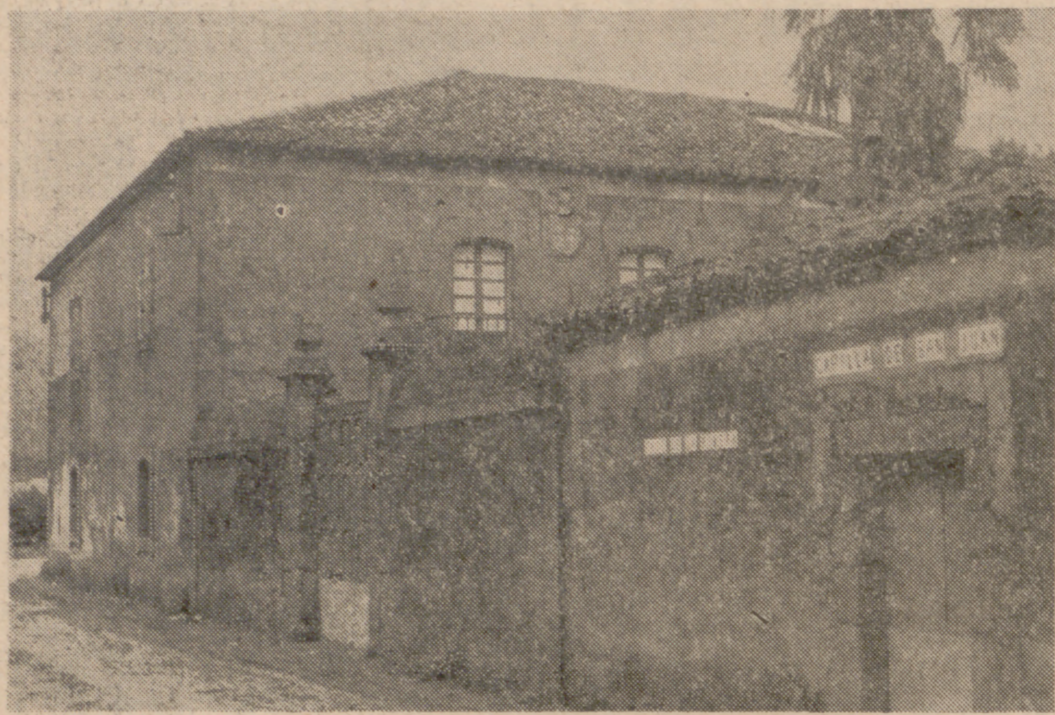
Esta es la casa solariega del Pazo de la Ribera de Qembre, en el Valle de Barcia, a 20 kilómetros de La Coruña, donde vivió doña Francisca de Montenegro, una mujer extraña, que murió soltera a los setenta y dos años de edad, sin hacer testamento.

Centenares de aspirantes de todo el mundo a una fortuna de más de doscientos millones de pesetas El misterio de doña Francisca de Montenegro