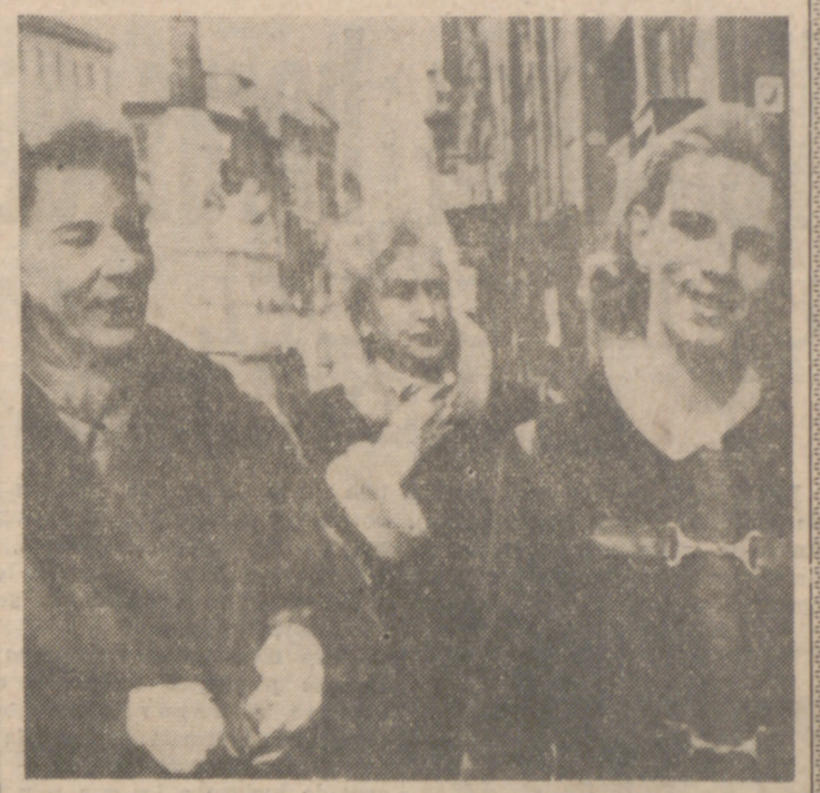
ROMA.—La reina Ingrid de Dinamarca y su hija la reina Ana María de Grecia, paseando por la Plaza de España, en Roma, durante una jornada dedicada a compras.