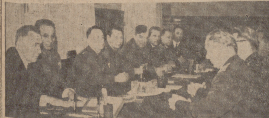
MOSCU.—Kosygin, presidente del Consejo de Ministros de Rusia, recibió en el Kremlin a una delegación militar de Checoslovaquia, encabezada por M. Dzur, ministro de Defensa Nacional. En la foto en el momento de las conversaciones.