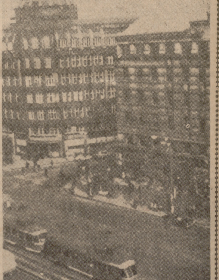
UNA VISTA DE PRAGA

tal, por ejemplo, confiesa que en 1963 habrá que contar con un déficit de 100.000 aparatos de radio y 33.000 de televisión; asimismo se notarán graves faltas en artículos tan variados y de primera necesidad como hornillos de gas, planchas y radiadores.