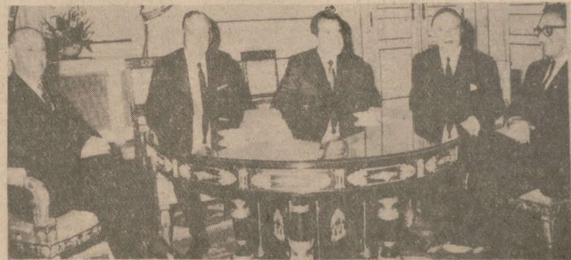
BRUSELAS.—Conversaciones en el Palacio Real de Bruselas. De izquierda a derecha aparecen Pierre Harmel, ministro belga de Asuntos Exteriores; William Rogers secretario de Estado norteamericano; el presidente Nixon; Gaston Eyskens, primer ministro belga, y el intérprete, Walter Vernon.

A las diez y media de la noche, aproximadamente, el presidente Nixon emprendió el regreso a Londres en automóvil, dirigiéndose al Hotel Claridge, donde todavía se encontraban en sus alrededores grupos de manifestantes forcejeando con la Policía.