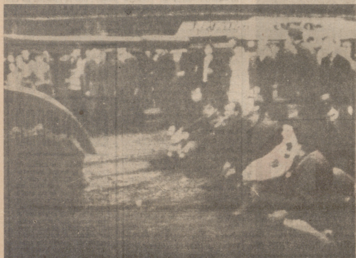
BRATISLAVA.—La televisión ha pasado en Checoslovaquia muchas escenas interesantes de la invasión rusa sobre la nación checa. En esta escena, obtenida de las cámaras de televisión, un grupo de checos, con valentía y sangre fría fuera de toda duda, se sientan en la calzada para detener el avance de los tanques soviéticos.

(Viene de la página anterior) incitación de sus minas y fábricas de industria pesada. Se ha impuesto el toque de queda en Fraga desde la media noche y cinco de la madrugada. En algunos establecimientos de la capital checa, principalmente las panaderías, se han agotado los alimentos. Algunas gasolineras han concluido sus reservas de combustible.