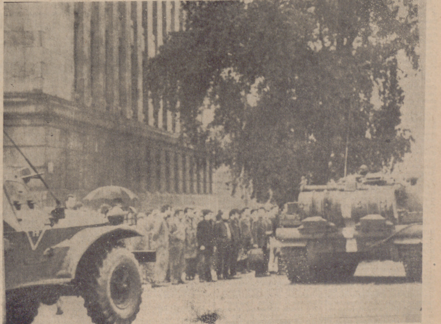
TROPAS DE OCUPACION RUSAS EN LAS CALLES DE PRAGA, ENFRENTO DEL PARTIDO COMUNISTA DEL COMITE CENTRAL DE CHECOSLOVAQUIA.

LONDRES, 22. (Efe-Reuter).—Un mensaje recibido de los empleados de las líneas aéreas checas informa que los ciudadanos de su país son muertos, se destruyen los monumentos culturales y se registran saqueos, según dice la agencia «Reuter». El mensaje radiado—un llamamiento para que todos los empleados de líneas aéreas apoyen a Checoslovaquia— fue recibido por varias delegaciones de líneas aéreas en Londres y otras capitales. El cablegrama, firmado por «los trabajadores de las líneas aéreas checas, dice: «Por favor, ayudarnos para mantener nuestra libertad, organizar acciones para apoyar a la Checoslovaquia ocupada.» NO HAY ALIMENTOS NI GASOLINA PRAGA, 22. (Efe-Reuter).—Nuevos efectivos blindados soviéticos han tomado posiciones en Praga esta mañana, mientras Checoslovaquia soporta la dominación rusa. El refuerzo de carros de combate ha llegado, al parecer, durante la noche, en la que se escucharon disparos y de vez en cuando el tronar de algún arma pesada. No obstante, no parece que haya resistencia en la capital. Emisoras de radio secretas, que se proclaman la voz libre del partido comunista checo, han hecho llamamientos esta mañana para que se realice una huelga general en la fundición de Vitkovice (Moravia). Los informes procedentes de Praga señalan que los residentes en Ostrava han oído disparos nocturnos. En esta localidad los obreros se resisten, según parece, a la