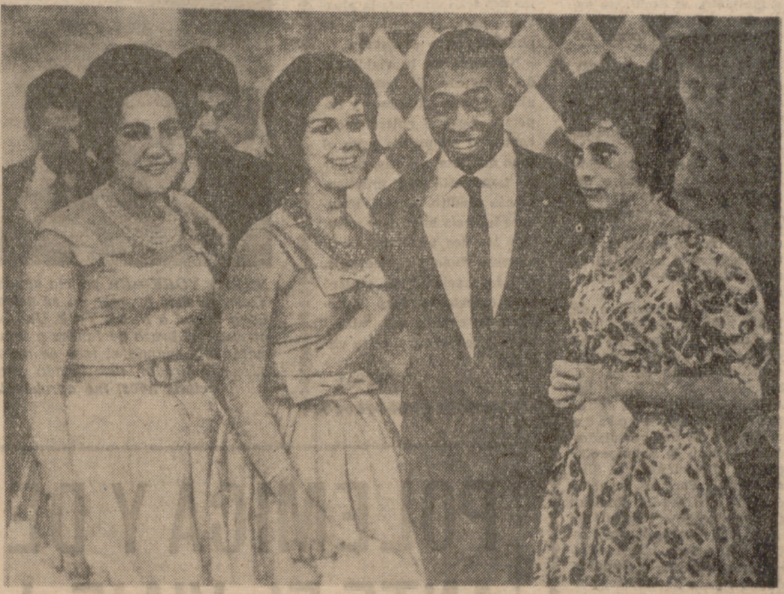
Pelé sigue en órbita, en pleno triunfo, fama y dinero. Aquí aparece en una fiesta rodeado de damas.

MADRID. — A medida que se acerca el próximo Campeonato del Mundo de Fútbol, que se disputará en 1970 en México, en Brasil, tierra donde este deporte se vive intensamente, renacen las esperanzas. No importan ya las escenas desgarradoras de desesperación que proporcionó la eliminación de Brasil a pies de los portugueses en el Mundial inglés. Se han tomado las cosas con tiempo y la preparación comenzó hace mucho. Pero hoy aún imposible de evitar que el recuerdo de los héroes del fútbol de 1958 en Suecia, se mantenga en la mente de los aficionados.