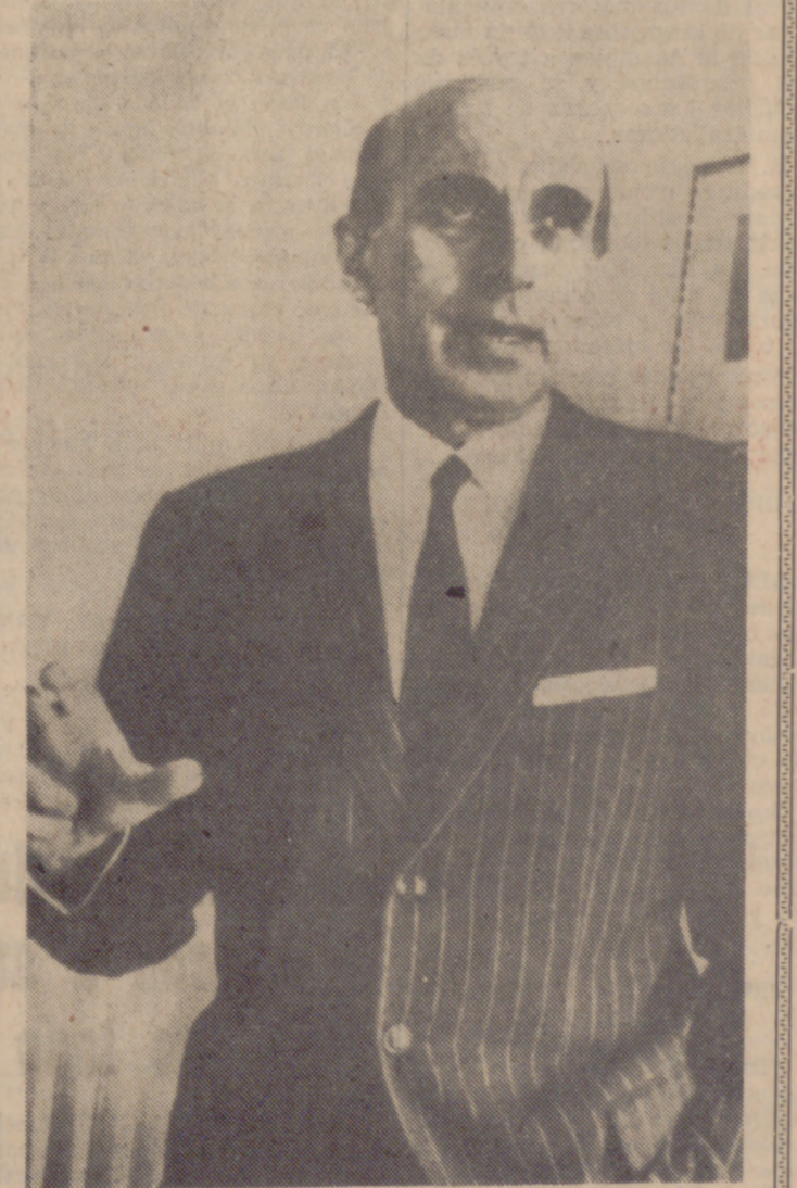
GENOVA (Italia).—Fotografía reciente del prominente médico italiano Carlo Sirtori, que ha propuesto un trasplante de corazón para el expresidente de los Estados Unidos, Dwight D. Eisenhower.