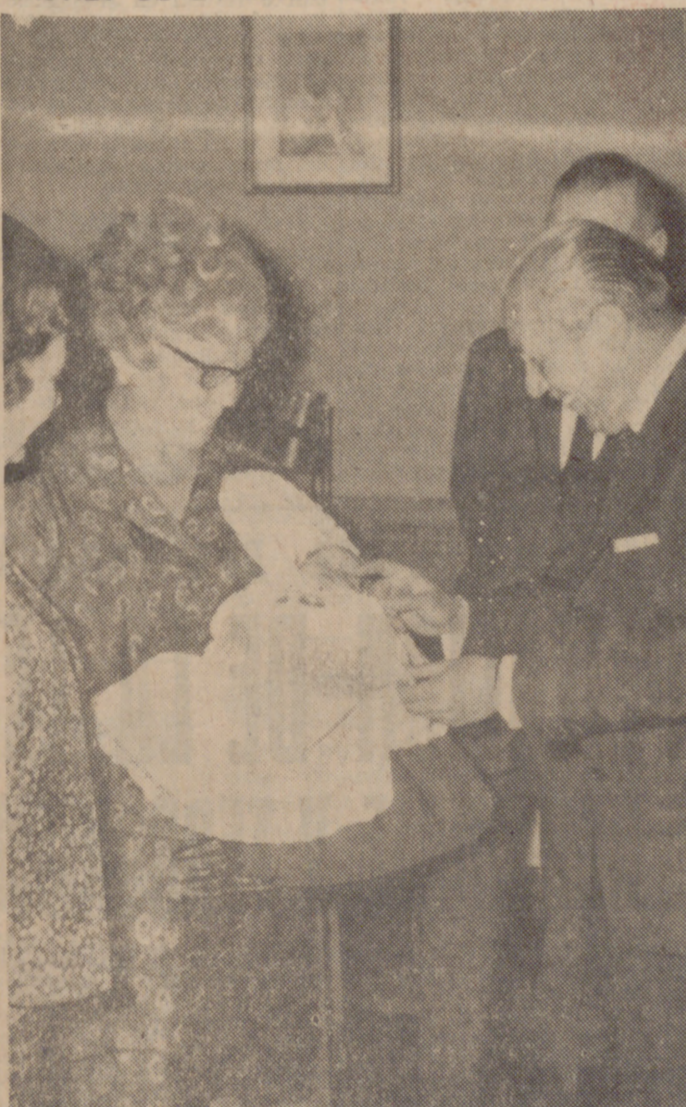
MADRID.—La niña "dos millones" Anabel, y el alcalde de Madrid, don Carlos Arias Navarro, han sido los padrinos del bautizo de la niña "tres millones", María del Carmen, en la madrileña iglesia de la Paloma. En la foto, el Alcalde acurruca a la niña "tres millones" en el Ayuntamiento.