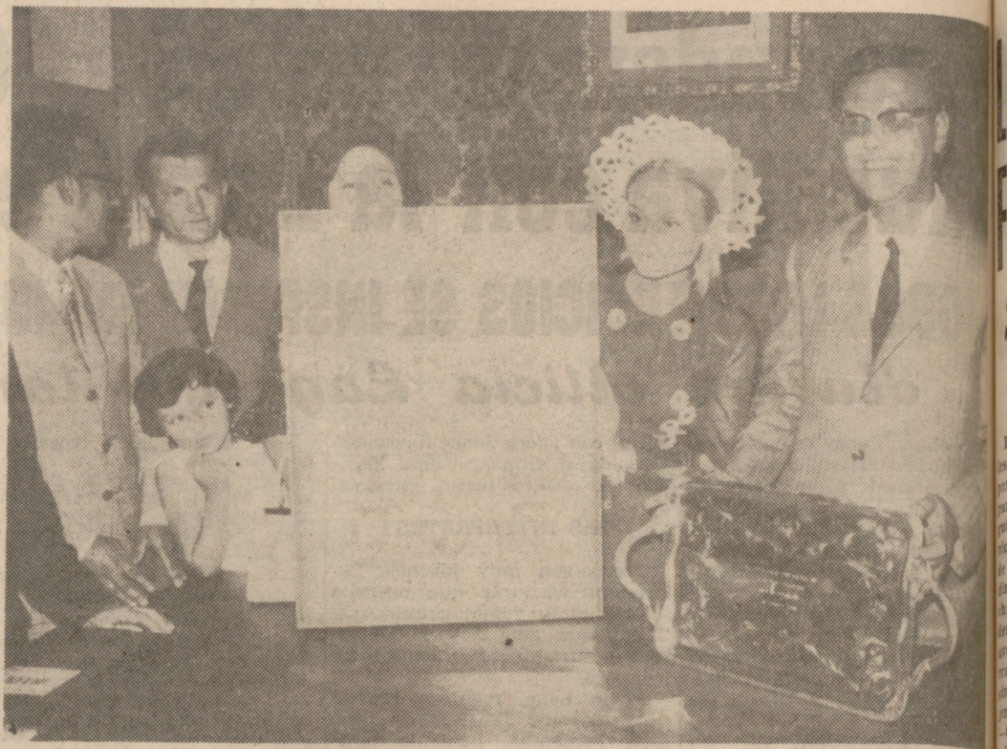
DURCAL (Granada).—La joven y bella actriz del cine español Rocio Durcal ha recibido el nombramiento de hija adoptiva de la localidad granadina de Durcal, en reconocimiento por haber elegido el seudónimo artístico del nombre del referido pueblo. También descubrió la actriz una placa que da su nombre a una calle de la villa. En la fotografía, Rocio recibe el pergamino acreditativo del título, como así también el obsequio de una bandeja de plata.