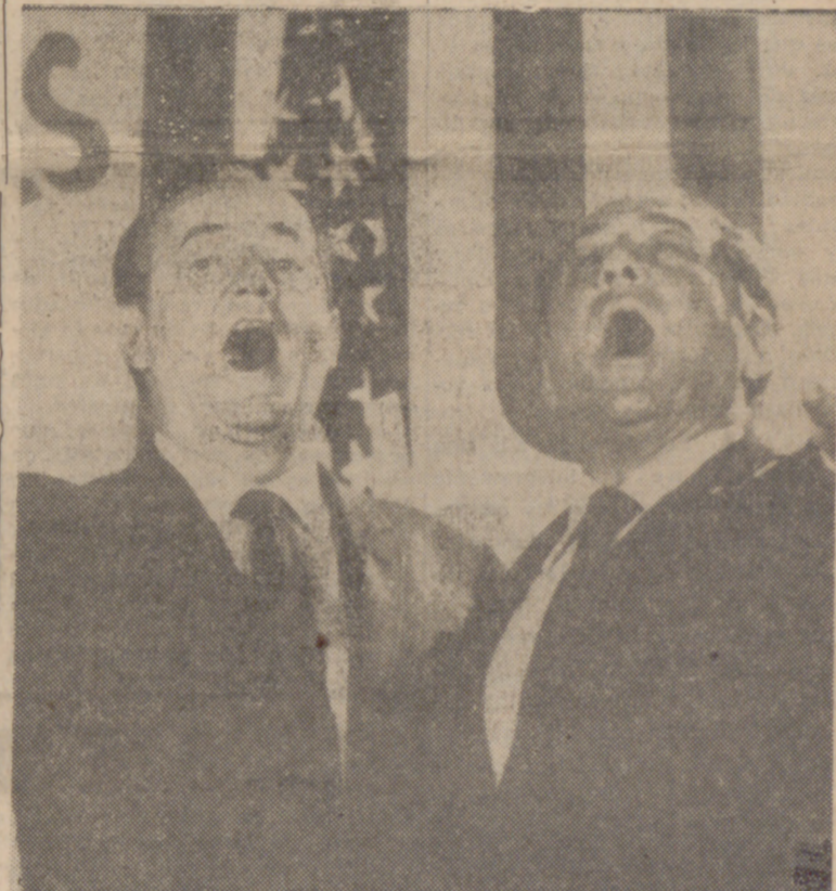
NEWARK (Nueva Jersey).—El vicepresidente Hubert Humphrey, que persigue la nominación democrata para la Presidencia, se une al cantante Robert Merrill en la canción "The Whifflepoat Song" durante una reunión dentro de la campaña.

La política de dureza de Johnson en Vietnam perjudica a Humphrey