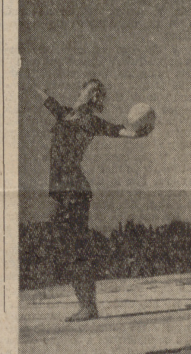
Bella estampa de unos ejercicios en la Escuela «Julio Ruiz de Alda».