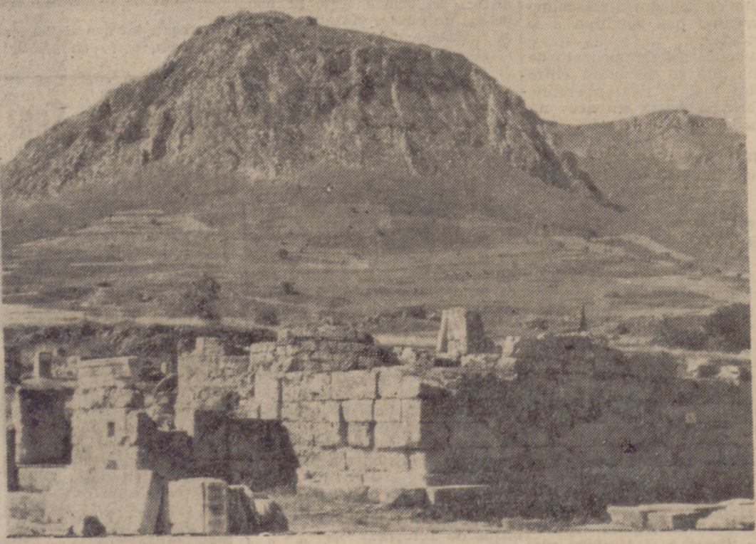
Corinto: a la derecha, y abajo a la izquierda, la fotografía, el lugar donde predicaba San Pablo.

Llegamos de mañana a El Piro, que forma, sin interrupción, con Atenas, una ciudad de dos millones de habitantes. Naturalmente, la visita imprescindible es a la Aeropólis, que actualmente sólo conserva cuatro monumentos: los Propileos, o sea los que forman la entrada en todas las Aeropólis; el templo de Victoria Nike (?) o Victoria Aptera, el Erecteón, que tiene el famoso pórtico de las Cariátidas, y el incommensurable Partenón, que destaca como un gigante en la altura. Falta a esta, soberbio templo la mayor parte de los elementos decorativos, arrebatados—cómo no?—por los británicos. Me refiero a los relieves de las metopas y a los de los frontones, que son