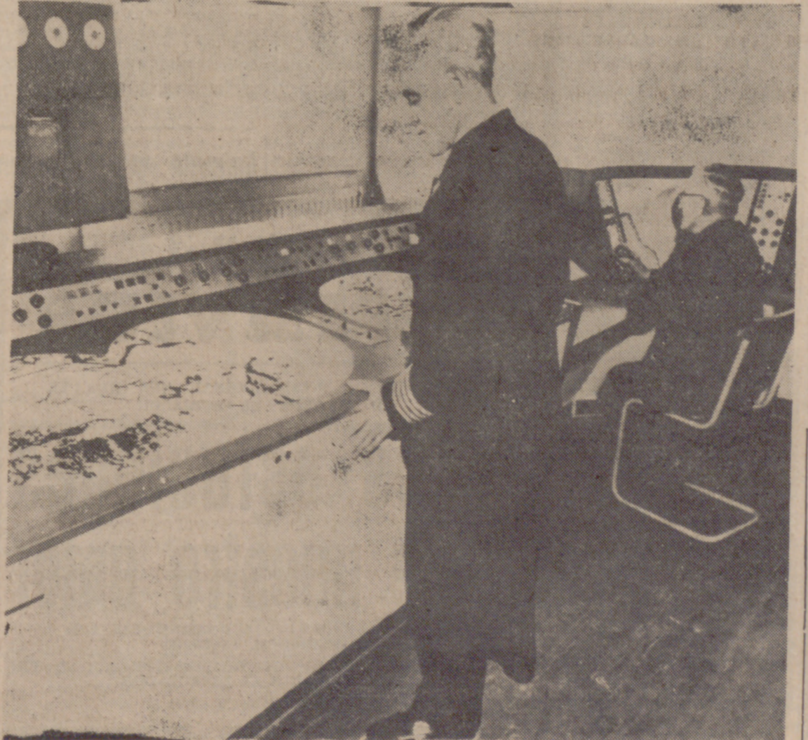
Para proteger debidamente los barcos se ha instalado un nuevo sistema de radar; el Photoplex, con el cual la zona queda fotográficamente integrada con la información radarica.