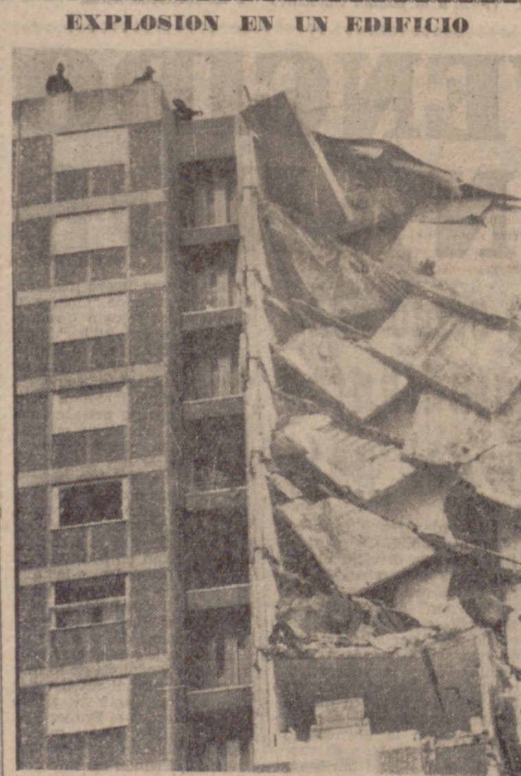
LONDRES.—Parte del edificio de 23 plantas que ha quedado parcialmente destruido a causa de una explosión en Canning Town, al este de Londres. Tres cadáveres han sido rescatados de entre las ruinas.

«No me cabe duda de que con buena voluntad y buena política, que tanto faltan actualmente, se podría encontrar una solución justa, salvaguardando plenamente los derechos de los gibraltareños».