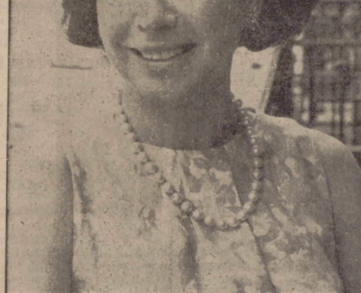
Aurora Bautista, la gran actriz española, ha vuelto. El teatro y el cine españoles le tenían reservado su puesto.

—Lo considero necesario. Cuando interpreté el personaje de Santa Teresa, lei cuanto pude de la Santa. Creo que esto es fundamental para identificarse con los distintos papeles. En la carrera de Aurora hay dos títulos trascendentales: el segundo—"Locura de amor"—y el penúltimo, hasta el momento, "La tía Tula". Con este film, Aurora nació para el nuevo cine.