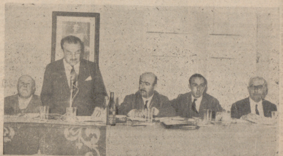
Presidencia de las Juntas generales del complejo FASA-RENAULT celebradas a mediodía de hoy en Valladolid. Asistió gran número de accionistas, que aplaudieron los acuerdos adoptados.

Hoy, 17 de mayo, se han celebrado en Valladolid las Juntas General Ordinaria y Extraordinaria de FASA-RENAULT, con la asistencia y representación de la casi totalidad de los accionistas de la Sociedad.