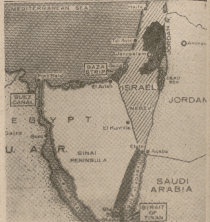
La parte árabe de la ciudad de Jerusalén, Sharm el Sheik, en la entrada del Golfo de Akaba, y otros territorios conquistados, incluyendo la zona de Gaza y la zona occidental del río Jordán, que en el mapa aparecen en negro, ocupados por las fuerzas armadas israelíes en la última confrontación bélica.

República independiente, proclamada el 14 de mayo de 1948. (Medinat Israel). Parlamento unicameral (Knesset) de 120 diputados (mayoría del Mapai, seguido por el Herut, el Nacional-religioso, el Agudat Israel (teocrático), minorías árabes, comunistas y Fuerza Nueva). Presidente de la República: Zalman Shazar. Presidente del Gobierno: Lavi Eshkol (del partido Mapai). Bandera: Blanca con dos bandas azules horizontales, y en el centro, la Estrella de David en un círculo blanco. Himno nacional: "Hatikvah" (La esperanza). No existe una Constitución, sino Leyes Fundamentales independientes.