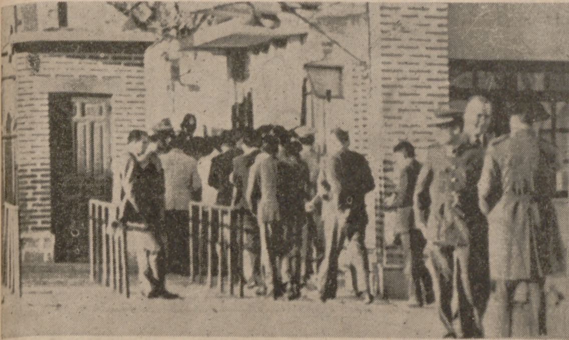
LA LINEA DE LA CONCEPCION.—España ha cerrado el puesto de Policía y Control de La Línea de la Concepción. En la foto, obreros españoles entran en Gibraltar para su diario trabajo.

El empeño de Londres de mantener el problema gibraltareño fuera de la órbita de las Naciones Unidas, (Pasa a la página siguiente)