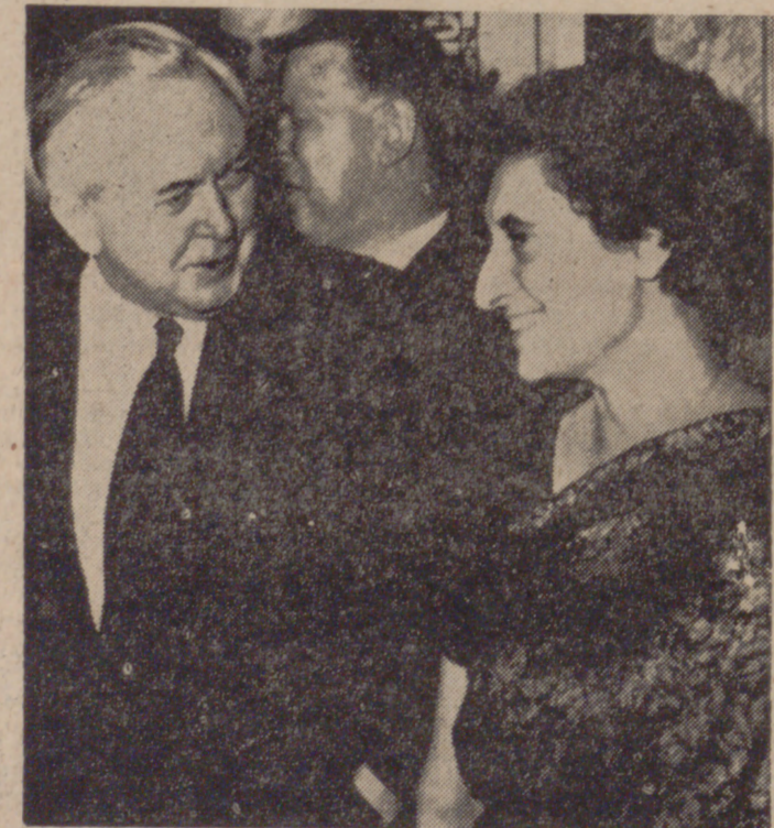
Indira Gandhi, en una entrevista con Wilson, primer ministro británico, en uno de sus viajes a Inglaterra.

Esta circunstancia frente a los ingleses hacia que sus padres se hallasen frecuentemente encadenados e Indira apartada de ellos y sola. No vivió Indira como los demás niños. Ella misma ha dicho: "No creo haber jugado con otros niños. Mi distracción era girarme a una mesa, con los sirvientes en torno a mí, a pronunciar inflamados