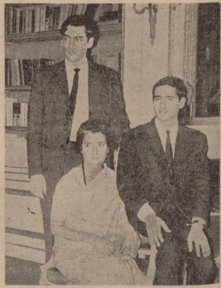
Indira Gandhi, con sus dos hijos, estudiantes de Ingeniería en París.

La idea política de Indira Gandhi está centrada en estas palabras suyas: "No veo al mundo dividido entre la izquierda y la derecha. Creo que la mayoría de nosotros estamos en el centro. En un país como la In-