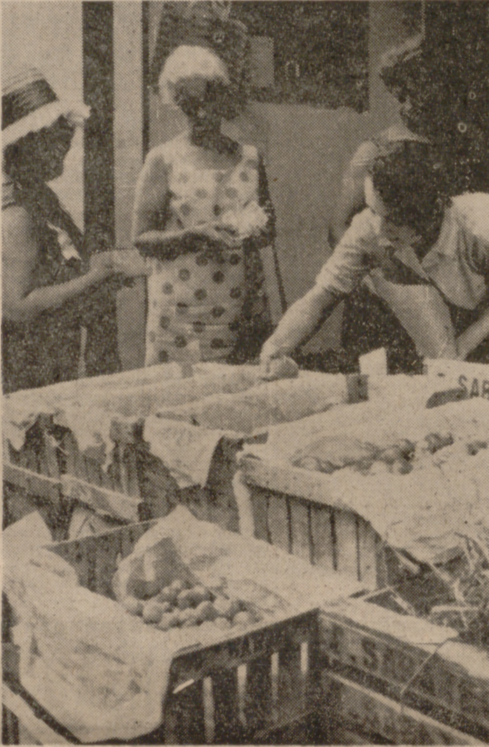
Turistas y precios.

La normalidad en los abastecimientos y la contención de los precios para este año