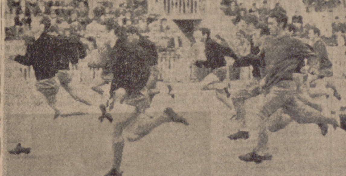
MADRID.—Con vistas al encuentro que disputan mañana frente a la selección de Inglaterra, los muchachos españoles han efectuado un entrenamiento ayer por la mañana en las instalaciones deportivas del Real Madrid. En la fotografía, un momento del entrenamiento.

MADRID. (AIFI).—La expedición británica de fútbol, cuyo equipo nacional se enfrentará al de España mañana, en el Estadio Bernabéu, en el encuentro de vuelta de cuartos de final de la Copa de Europa de naciones, llegó ayer a Barajas.