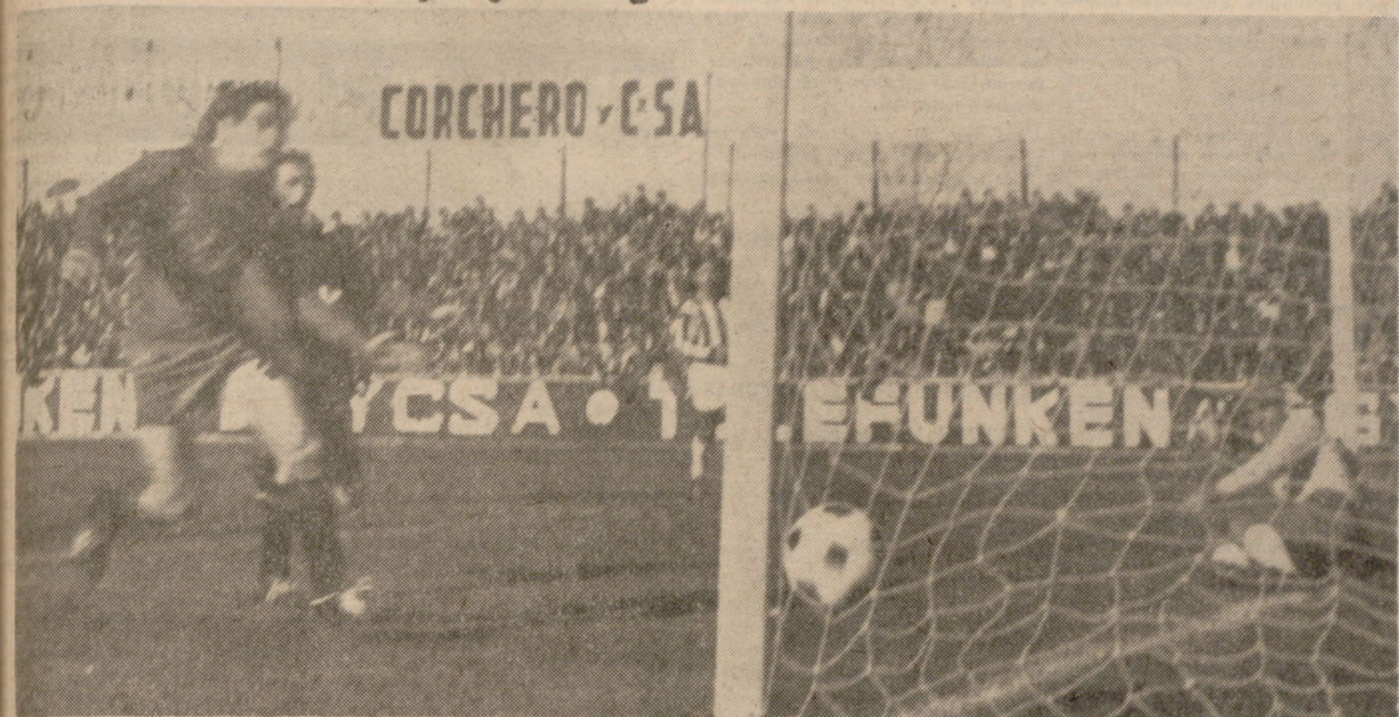
PRIMER GOL.—Vendrell, caído en el suelo, ve cómo el balón, tras pegar en el poste contrario, entra en la portería. Era el primer gol de la tarde.

Fallos de marcaje y ningún acierto, ni lucha adelante