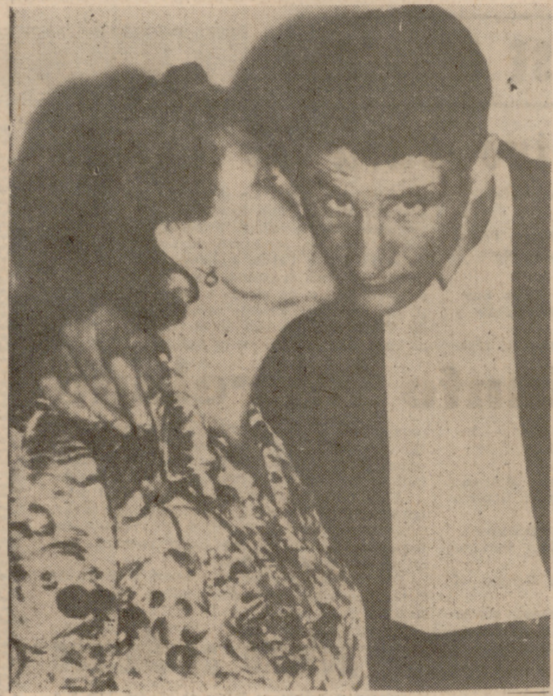
FOLLEDO CON SU MADRE

—No, no estuve mucho tiempo en la escuela, porque desde muy