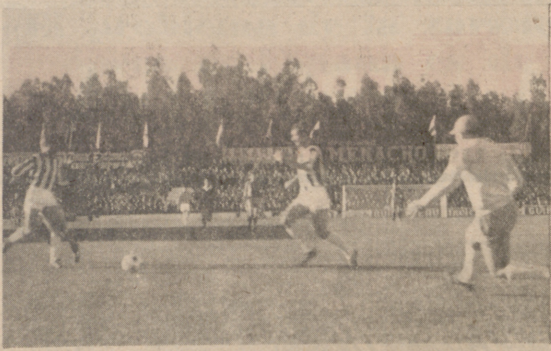
Una de tantas jugadas insulsas ante el morco pacense. No pasaría nada.

(Viene de la página anterior) tulares vallisoletanos apenas si habían tenido tiempo de estirar las piernas retonzadamente sobre la mu- llida hierba del Vivero, subía el primer gol al marcador, tan faci- lmente, tan sin oposición, tan fá- cilmente, tan sin oposición, como puede entrar en el minuto inicial.