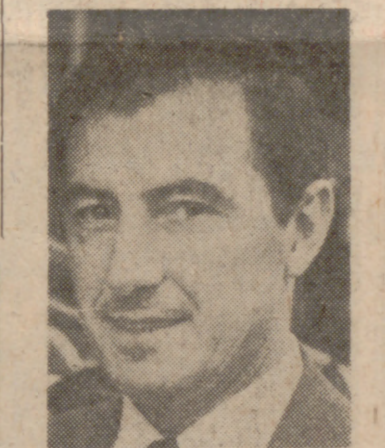
—Nada que oponer al resultado. El Badajoz ha sido un legítimo ganador porque ha luchado para adjudicarse los puntos.