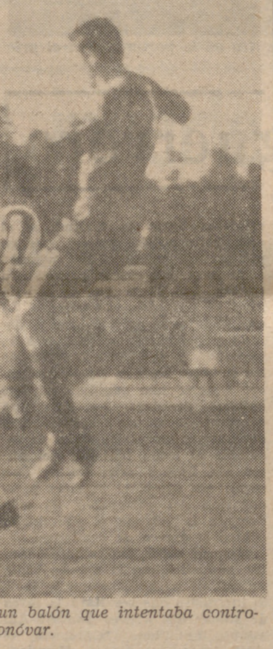
Quique salta, enviando fuera un balón que intentaba controlar Monóvar.