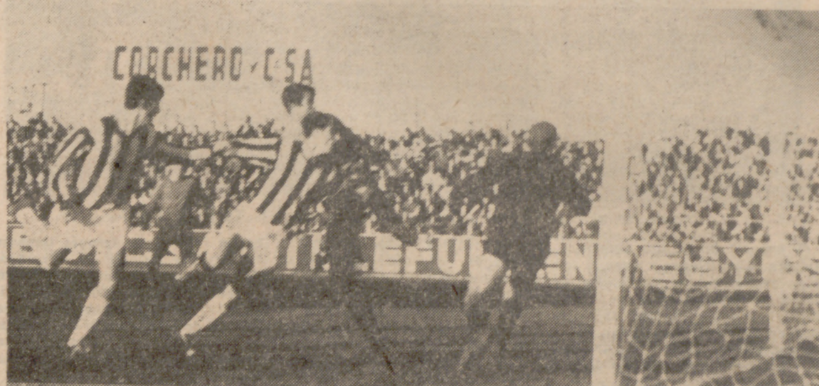
EMPATE.—Monóvar rectifica el remate de su compañero, anticipándose a Rivas. Era el gol del empate.