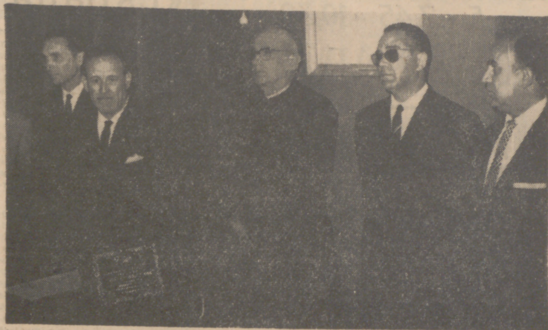
EL DELEGADO DE LA VIVIENDA PRONUNCIANDO PALABRAS DE AGRADECIMIENTO