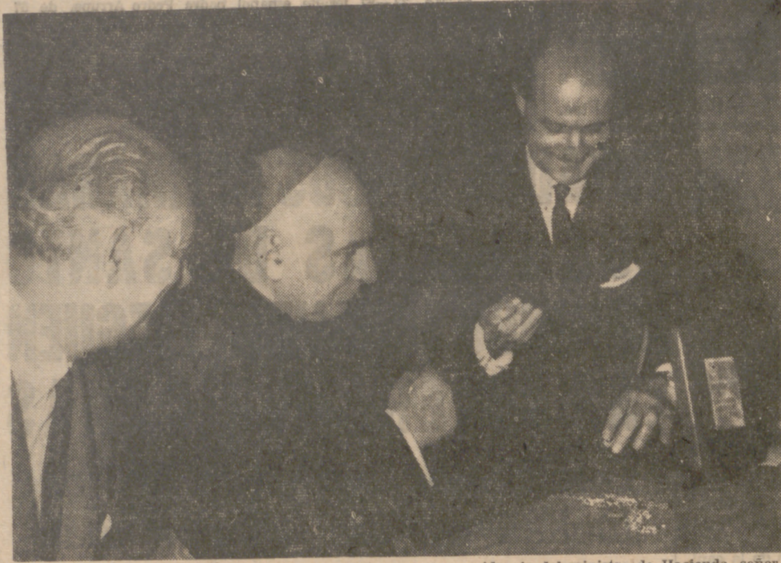
MADRID.—En el Instituto Social León XIII y bajo la presidencia del ministro de Hacienda, señor Navarro Rubio, los abogados del Estado han tributado un homenaje al cardenal Herrera Oria, durante el cual le fue entregado un pectoral y un donativo en metálico para sus obras religiosas y sociales. Hizo la entrega el director general de lo Contencioso, don Luis Peralta España, en representación de los abogados. En la fotografía, un momento del acto.