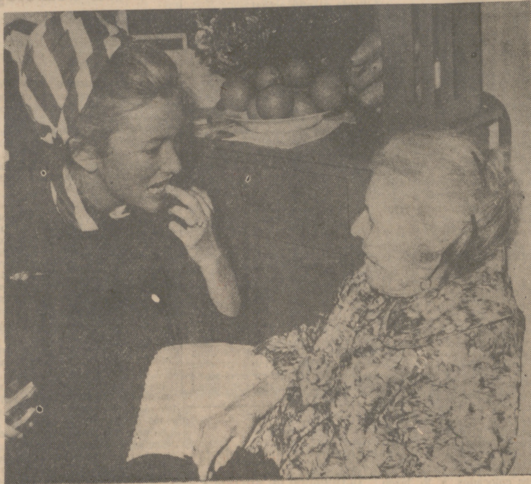
La princesa Paola visita a la centenaria italiana, nacionalizada belga, Jannetta. En nombre de Fabiola y Balduino le llevó diversos regalos y felicitaciones afectuosas. Jannetta cuenta a la princesa, que la escucha con gran atención, cómo llegó ya muy madura a Bélgica a principios de siglo y cómo desde hace mucho tiempo se ha ganado la vida tocando un organillo por las calles de Borgherent (Amberes)