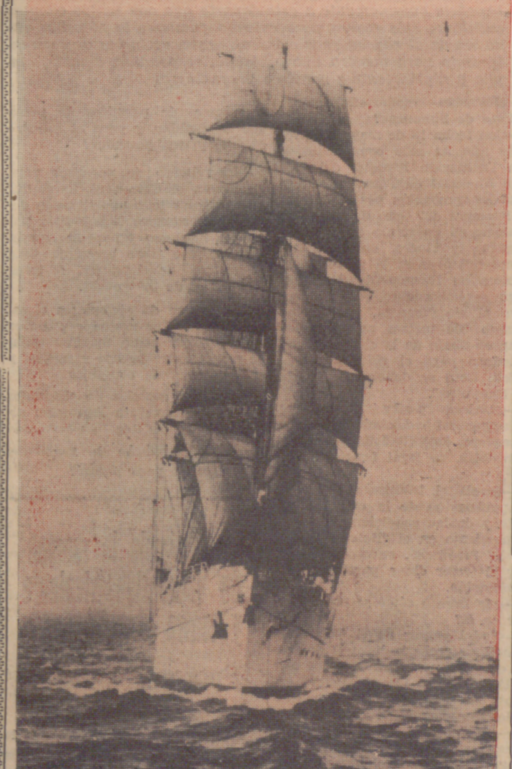
Este es el "Gorch Fock", un buque-escuela alemán, en el que las nuevas generaciones de marineros de Alemania occidental vienen formándose con vistas a integrar las dotaciones de las flotas de guerra y mercantes del país. Este barco, de tan bella estampa, participará, con nuestro "Juan Sebastián Elcano", en la Semana de Kiel del presente año, entre los días 20 al 27 de junio. Uno y otro se disputarán la mayor atención del público en el gran desfile internacional de grandes veleros, del que formarán parte también barcos de otras nacionalidades, dedicados, como aquéllos, a la formación de los futuros hombres del mar.