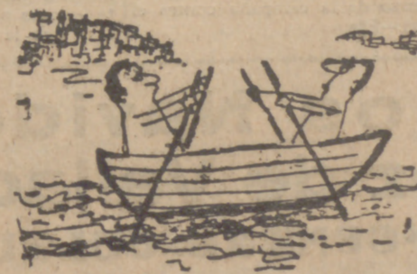
—El paisaje resulta monótono. Llegamos media hora viendo lo mismo.

(SOLUCION AL CRUCIGRAMA EN LA SECCION DE ANUNCIOS ECONOMICOS)