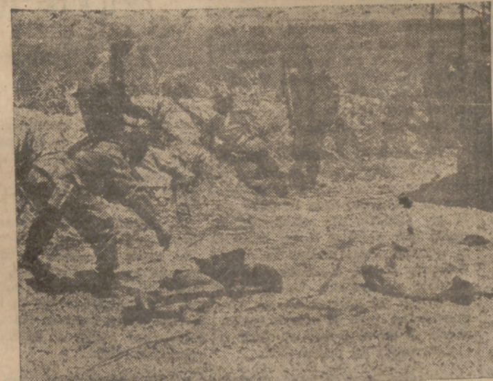
Cuadro de los últimos sucesos del Congo.