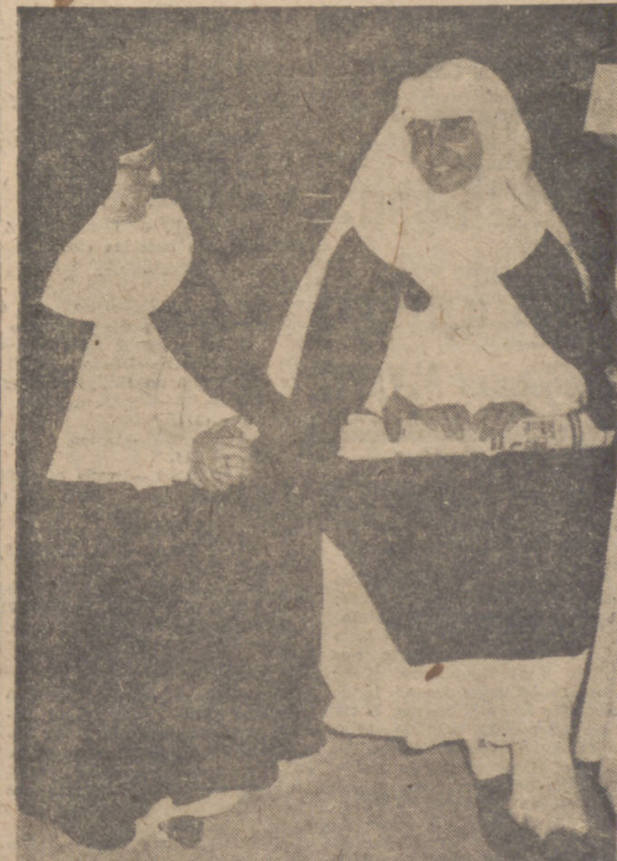
En la presente fotografía aparece una de las misioneras rescatadas del Congo, que resultó herida en una pierna, conversando a su llegada al aeropuerto de Barajas con los informadores de Prensa La compañía una hermana de hábito de las que salieron a recibirlos.