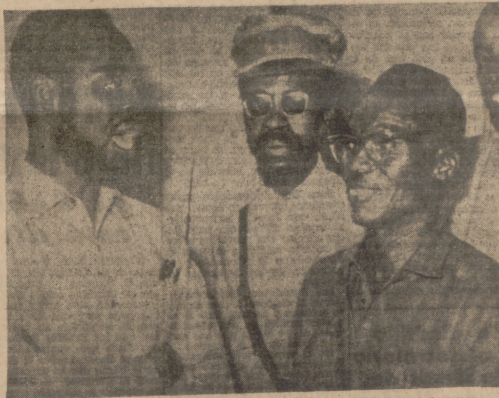
El principal responsable de los crímenes: Uristobal Gbenye, con su estado mayor.