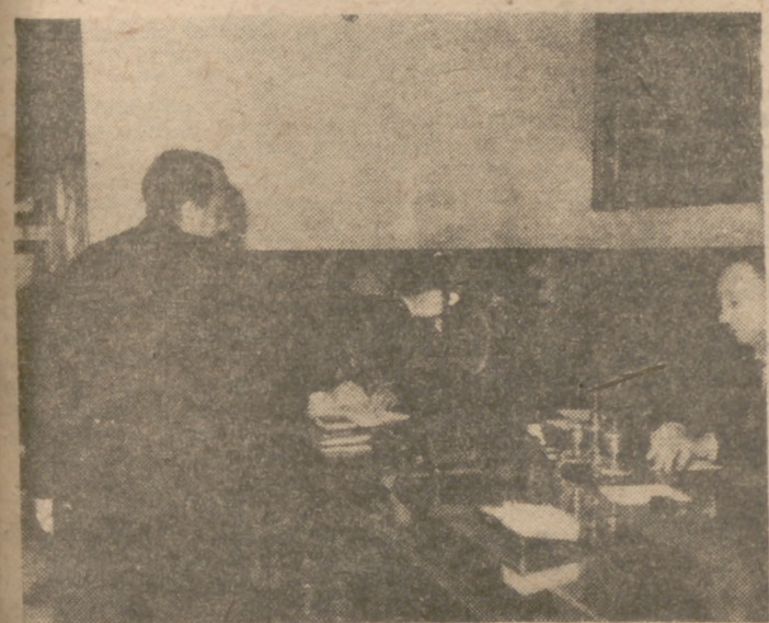
MADRID.—En el Palacio de las Cortes Españolas se han celebrado las votaciones para la elección del puesto vacante de consejero del Reino por el grupo de Universidades, resultando elegido el rector de la Universidad de Madrid, don Enrique Gutiérrez Ríos. En la foto, un momento de las votaciones.