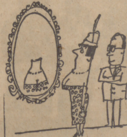
—Como te decía, era el espejo de María Antonieta.