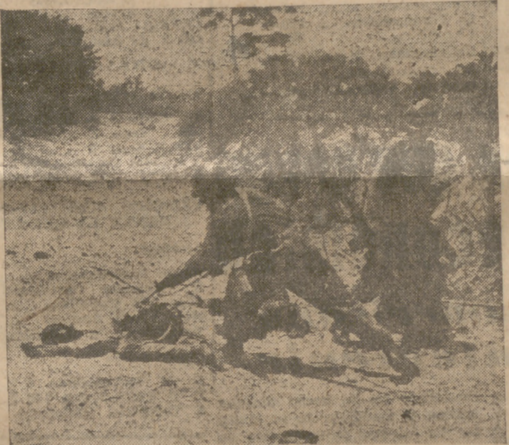
El cadáver de un soldado abandonado por los rebeldes en su retirada.

El conferenciante indicó que no se conoce una causa directa cancerosa de la grasa o materias similares, sino sólo la de aquellos productos de oxidación proveniente de grasas derivadas. Además, dijo, hay claros ejemplos de una influencia cocarcinógena de determinadas partes grasas. Se encuentran en materias que no provocan directamente el cáncer, pero que refuerzan el peligro cuando hay factores cancerígenos.