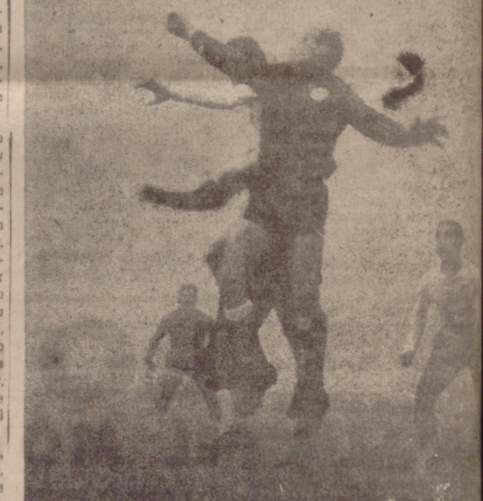
ACOSO ENTRE LA NIEBLA.—La densa niebla del segundo tiempo fue un grave obstáculo para los espectadores. En el grabado, uno de los tímidos ataques vallisoletanos, que no fue resuelto de puño.

guridad, no hay verdadero afán, no hay nada. Nada de lo necesario para poder salvar con acierto la situación.