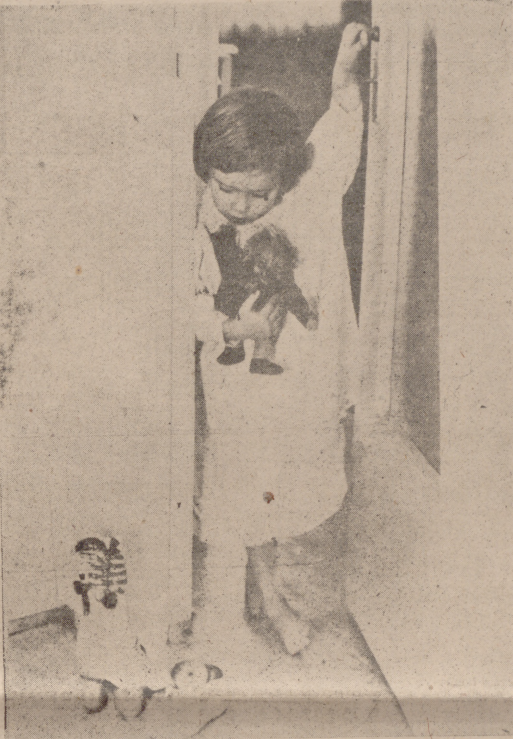
HAMBURGO. —Todos los años viene en Alemania San Nicolás para visitar a los niños. San Nicolás es una figura legendaria que en todas partes de la Europa central, y hasta en la misma Alemania, aparece bajo nombres muy distintos. En la Alemania occidental tiene el aspecto de un viejo con barba blanca y un abrigo rojo con capucha, adornado de pieles. Trae a los chicos obediénte durante el sueño sabrosos dulces, mientras que para los niños malcriados coloca una férula en sus zapatos bien lustrados.