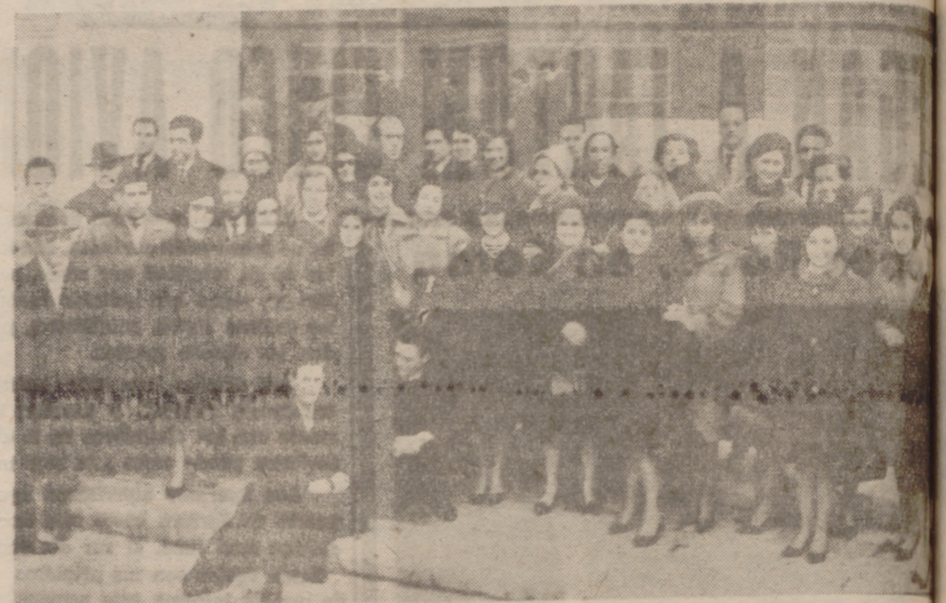
Un grupo de esperantistas vallisoletanos, a la salida de la misa celebrada en la iglesia San Lorenzo.

El grupo de Valladolid celebró diversos actos en 105 aniversario del nacimiento de Zamenhof