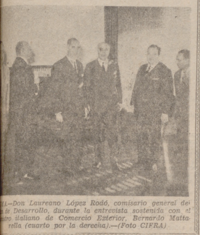
Don Laureano López Rodó, comisario general del Desarrollo, durante la entrevista sostenida con el ministro italiano de Comercio Exterior, Bernardo Mattarella (cuarto por la derecha).

JARTUM, 14.—Cinco aviones militares argelinos de transporte, de fabricación soviética, conducidos por tripulaciones compuestas en su totalidad por rusos, han aterrizado en el aeropuerto de Jartum, según han indicado fuentes bien informadas. Se cree que los aviones llevan suministros para los rebeldes del Congo, a la den las citadas fuentes.