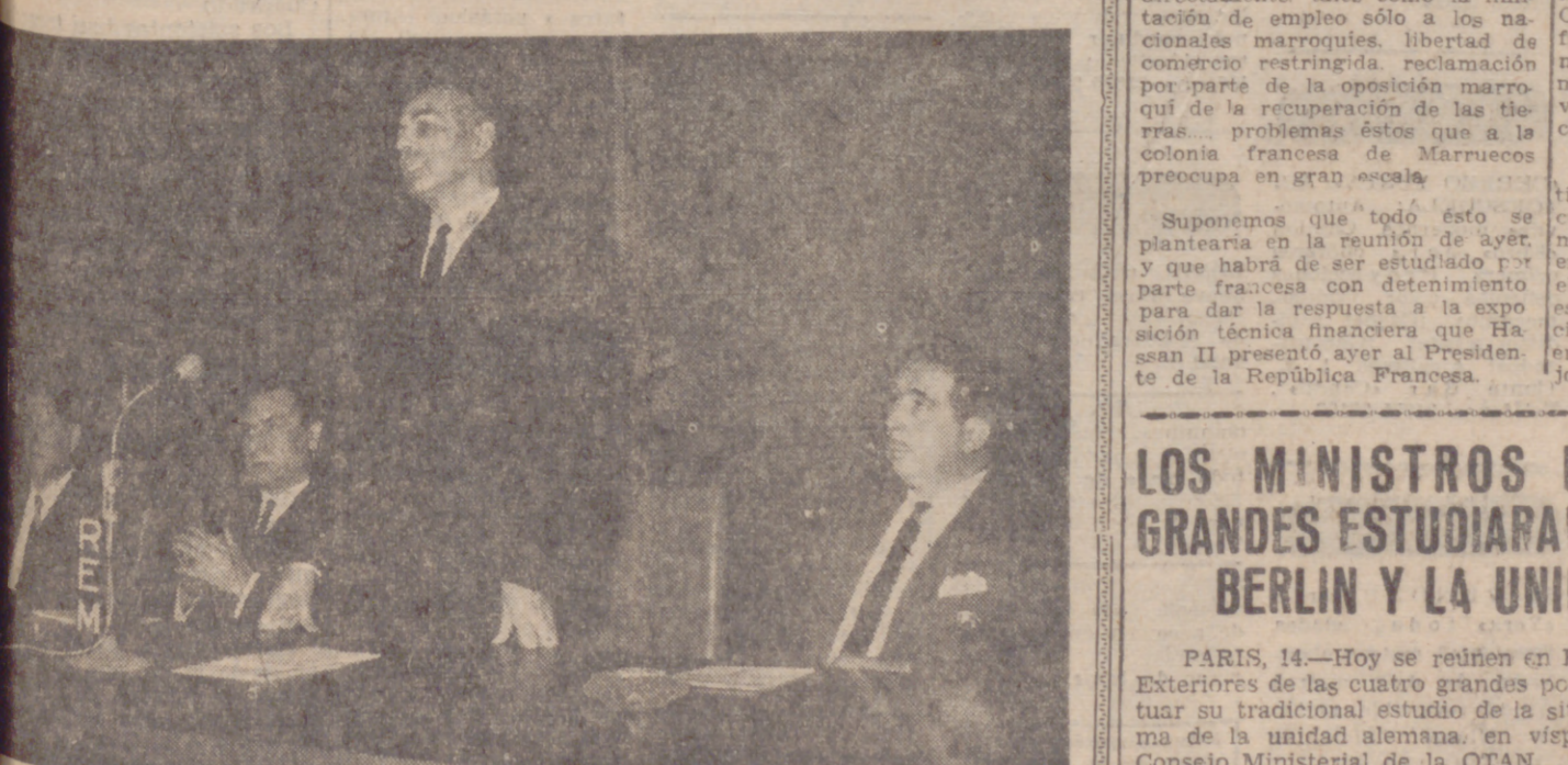
El ministro secretario general del Movimiento, señor Solís, preside la clausura de las II Jornadas de Estudios Políticos y Formación de Cuadros en el Instituto de Estudios Políticos. En la foto, el señor Solís pronuncia unas palabras durante la clausura.