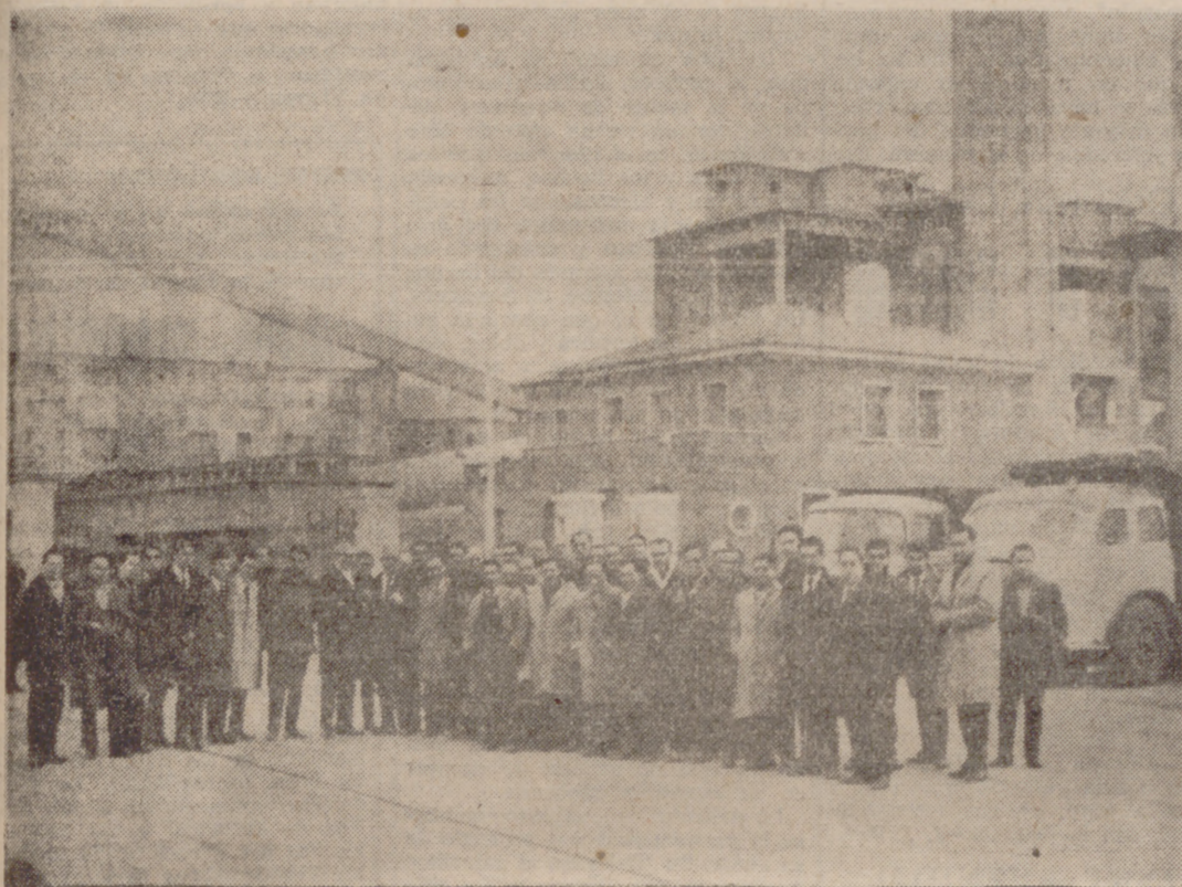
VISITA A LA FABRICA

Continúa desarrollándose el Curso de Instructores Sindicales en Seguridad e Higiene en el Trabajo que para productores de la industria de la Construcción se está celebrando en la Delegación Provincial Sindical.