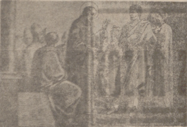
SAN ESPIRIDION, OBISPO

asome al mundo de la riqueza y el buen gusto, leyendo de las edificaciones caras, que algunas veces sólo lo son por el empujamiento, sin adarme de lujo formal, que el público adulto satisfecho porque le agrada a sus sentidos. El aluminio, que se produce masivamente en Valladolid, debe tener una representación digna en el colegio de esta pequeña urbe que empieza a dejar su pequeñez y a mirar con altura porque tiene categoría para presentarse bien, sin fellos pucheros.