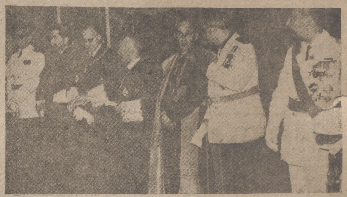
En la fotografía, el Capitán General, Gobernador Civil y Jefe Provincial del Movimiento, Arzobispo, Presidente de la Sala de lo Civil, Fiscal Jefe de la Audiencia, Rector de la Universidad, Delegado de Hacienda y el Presidente de la Diputación durante la recepción celebrada en Capitanía General, en conmemoración del XXVI aniversario del Alzamiento Nacional.

(INFORMACION DEL ACTO EN PAGINAS INTERIORES)