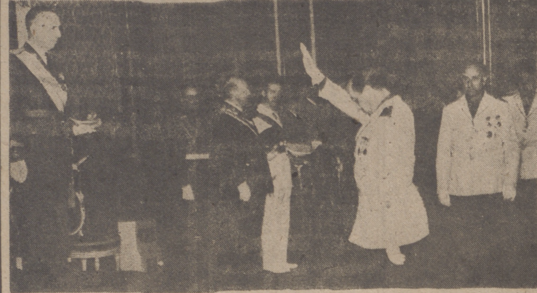
UN MOMENTO DE LA RECEPCION EN CAPITANIA