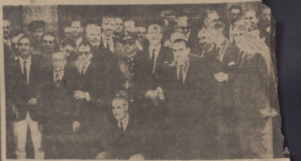
Los Alféreces Provisionales con el Presidente de la Hermandad y Junta Directiva, a la salida de la celebración en San Felipe Neri.

Misa en San Felipe Neri y cena de hermandad