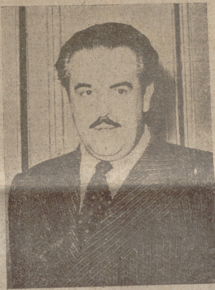
(Pasa a octava página)

A vosotros se os encomienda uno de los más importantes: acabo el más importante de la Historia contemporánea en el orden civil. Porque se trata nada menos que de levantar esa cosa sagrada, ese espacio del mundo santificado, desde el principio de las edades con tantas virtudes, esa cosa es-