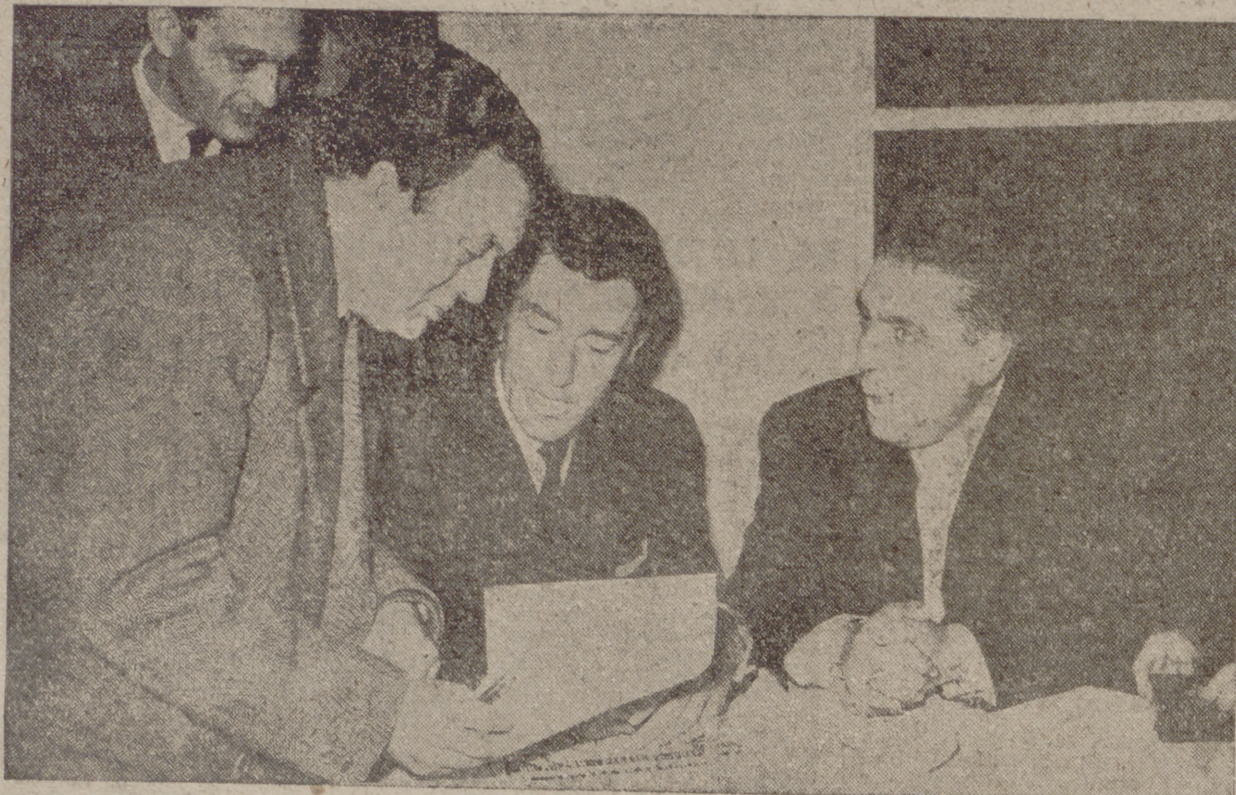
Madrid.—El famoso campeón ciclista Luisón Bobet, acompañado del presidente de la Unión Velocipédica Española, señor Del Caz, a la derecha, y del comisario general de la Vuelta Ciclista a España, señor Iturriz, en el momento de firmar el contrato de su participación en la "ronda" española.