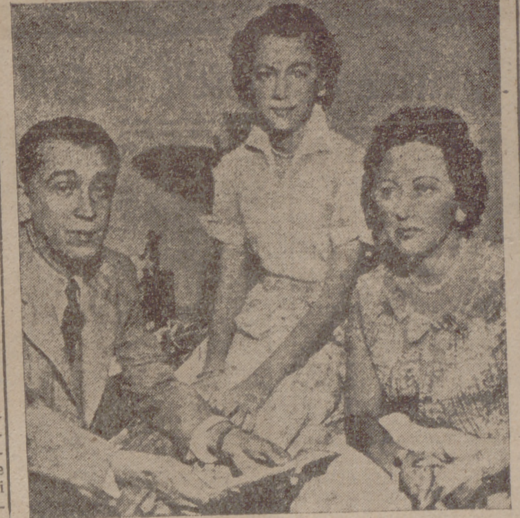
El presidente brasileño con su esposa e hija.

(Viene de primera página) puedan vivir con más comodidad y honradez como ciudadanos de una misma patria, como hermanos de la misma familia, en la gran patria brasileña, de la familia de los hijos de Dios. Y conociendo los sentimientos de V. E. Nos estamos seguros de que, junto con el desarrollo económico y material, V. E. tomará muy a pecho la elevación del nivel espiritual, que dará al primero su verdadera fisonomía y dignidad, animándolo y dignificándolo con la caridad cristiana, de forma que, previniendo y eludiendo los antagonismos y las luchas de clases, se estreche cada día más la unión y concordia de todos los ciudadanos y, consiguientemente, de todos los Estados.