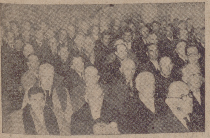
Un aspecto de la sala, durante la conferencia.