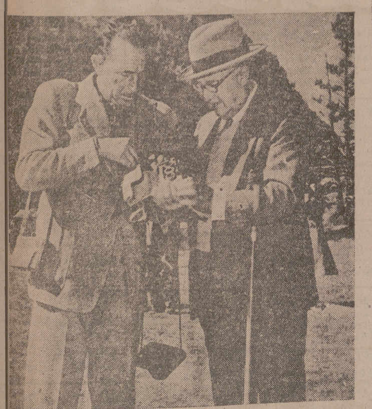
Caudillo hace un alto en el camino durante su recorrido a la cuenca del Ribagorzana para tomar unas fotos del intenso quehacer...