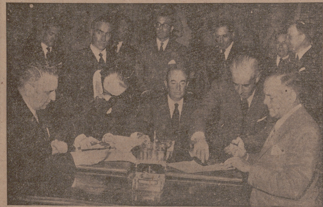
MADRID.—En el Ministerio de Asuntos Exteriores se ha celebrado el acto de la firma del acuerdo hispanoamericano de suministros de excedentes agrícolas. Los ministros de Asuntos Exteriores y el de Comercio con el embajador de los Estados Unidos en el momento de la firma.