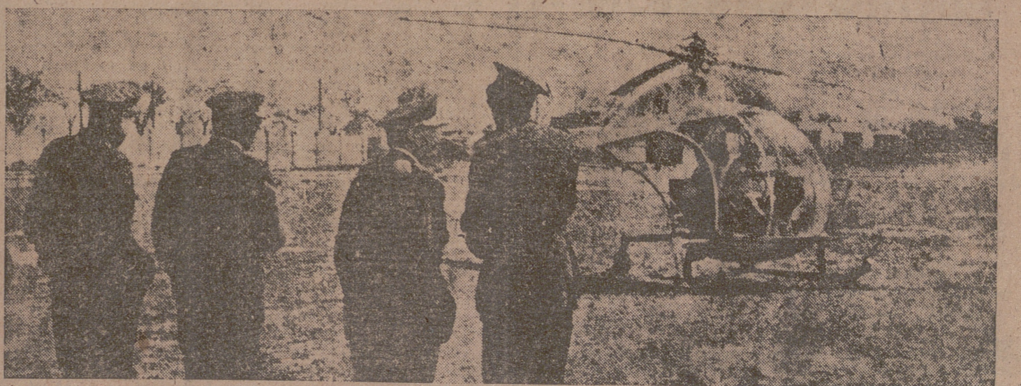
El pasado miércoles se celebraron en el aeródromo de Getafe pruebas con el primer helicóptero a reacción (el AC 13), de construcción española. En nuestra fotografía, el momento en que el helicóptero se posa en tierra, en presencia del ministro del Aire, señor González Gallarza y otras personalidades.